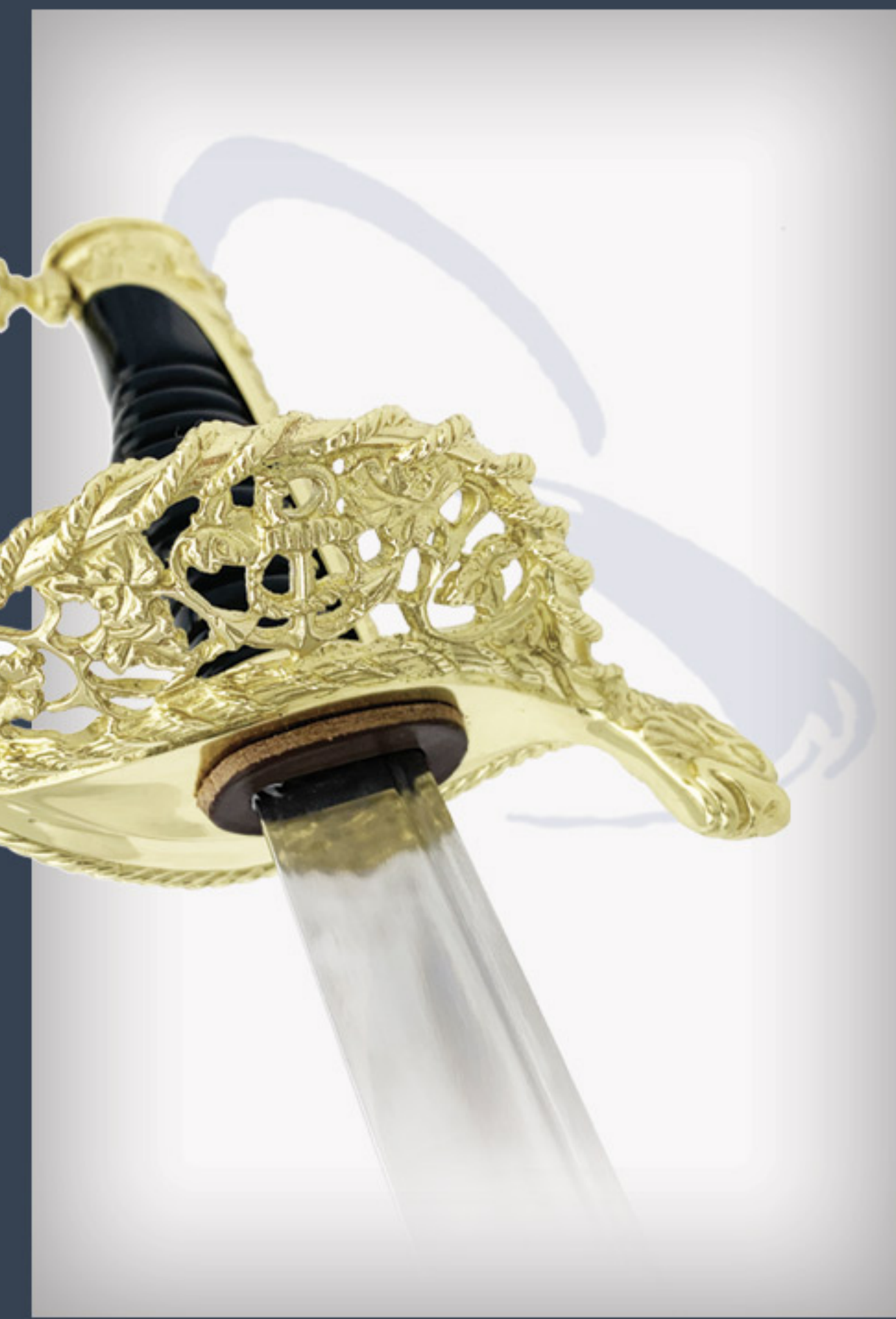
Saber de marine Navy sword