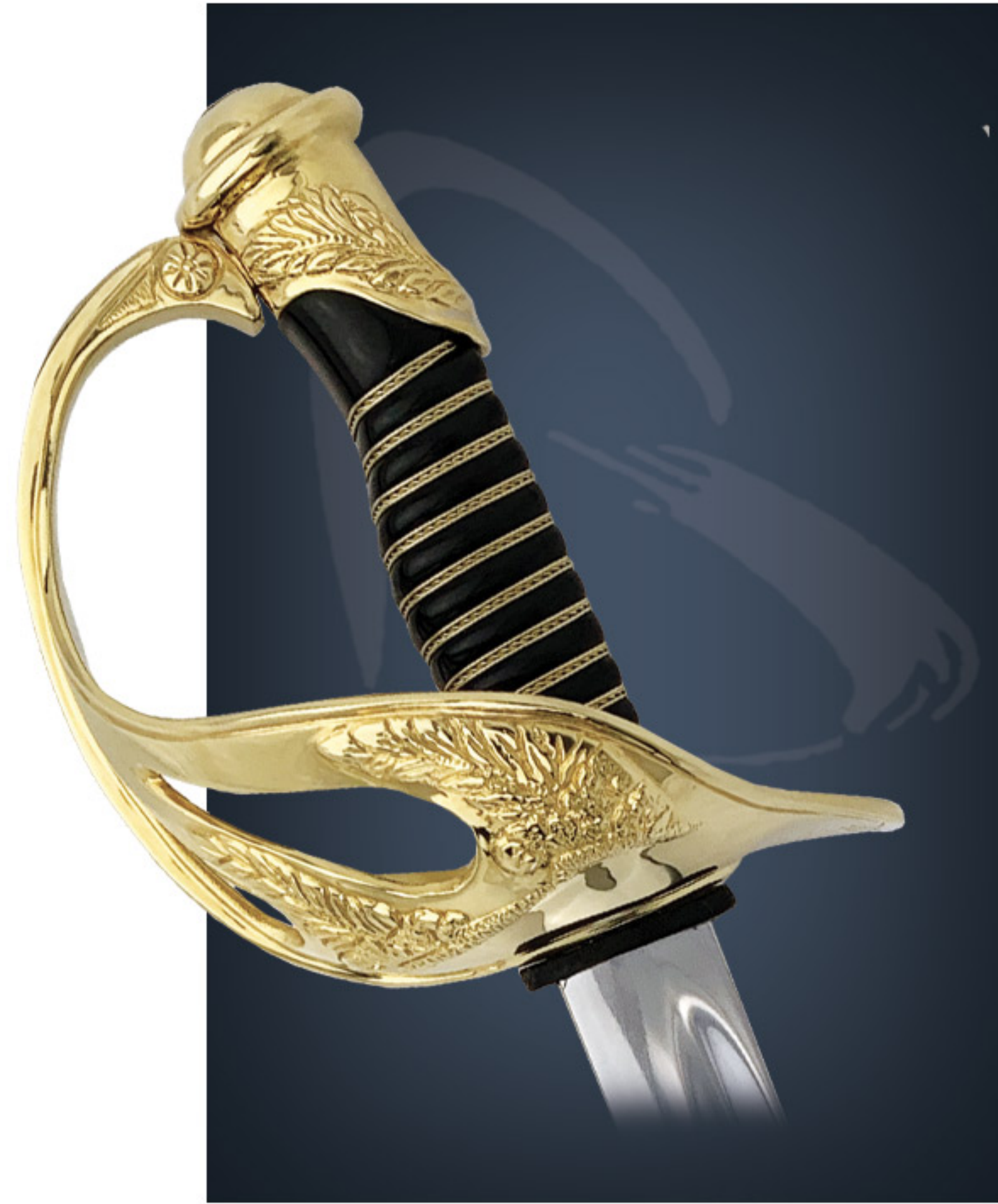
Sabre EMIA EMIA sword