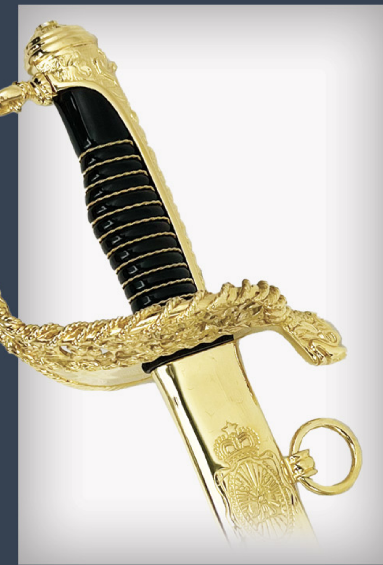
Saber de marine royale Royal navy sword