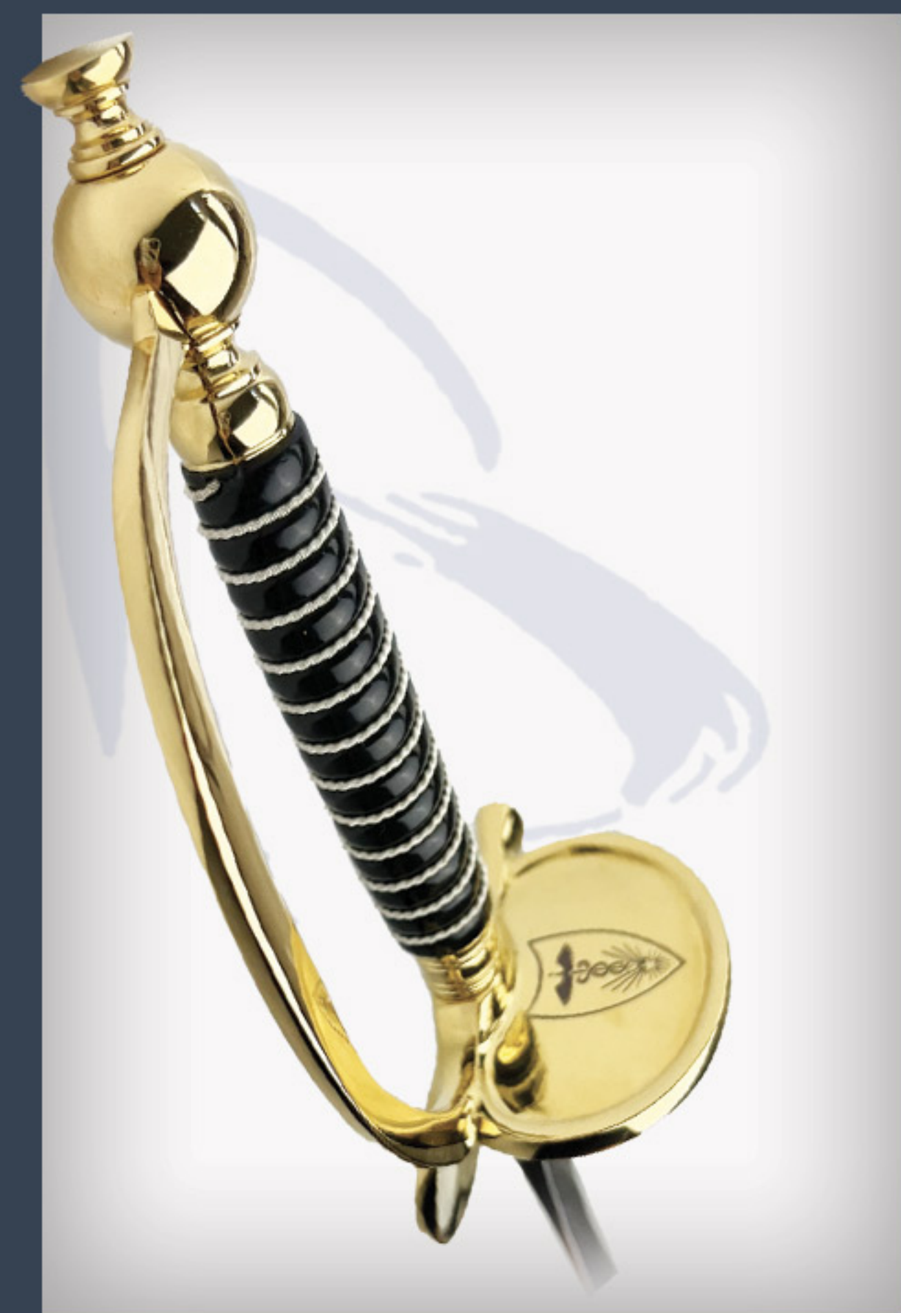
Epee EMS EMS sword