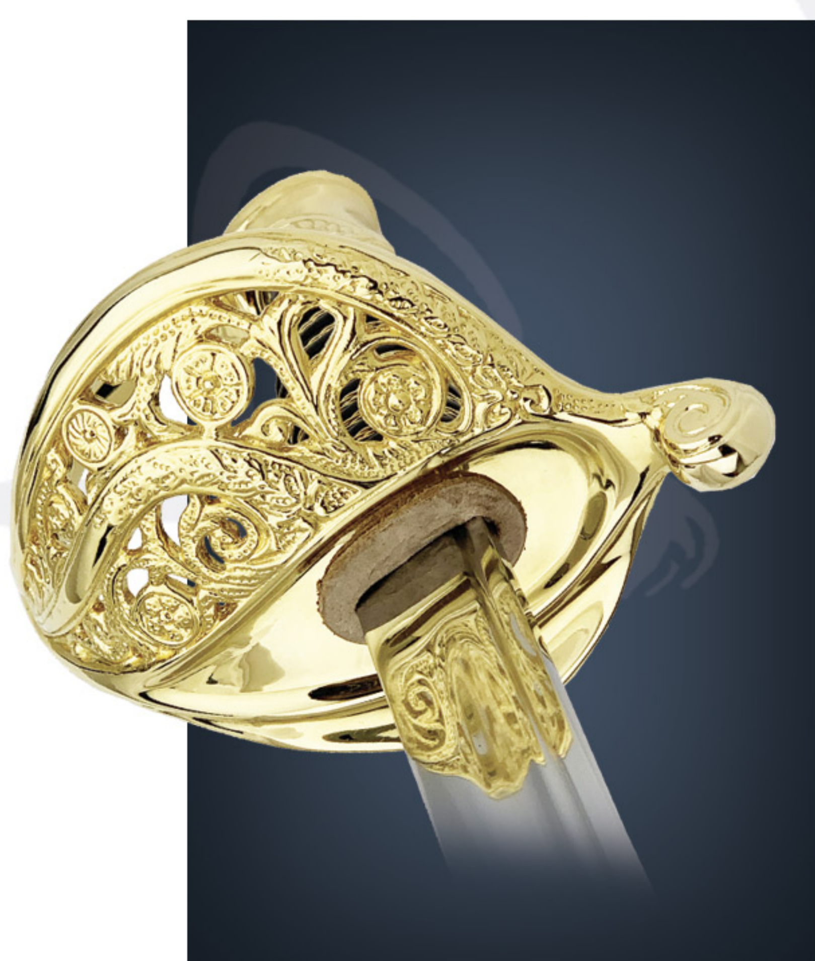
Sabre m/1845 m/1845 sword