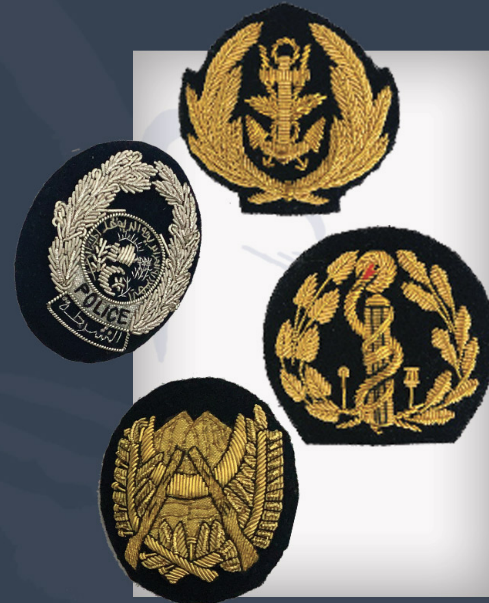
Ecussons Cap badges