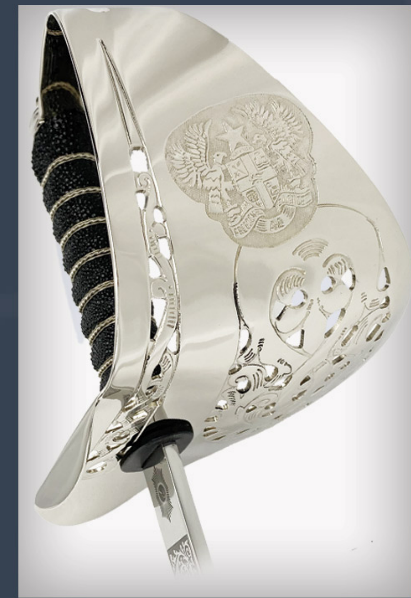
Saber infanterie Infantry sword