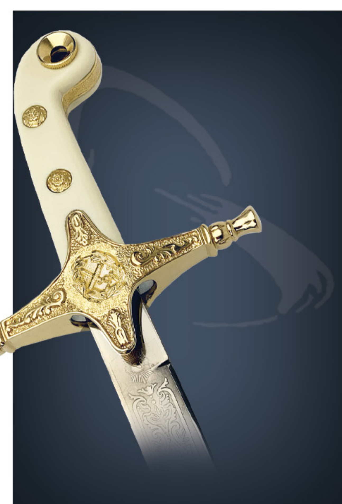
Sabre cimenterre Scimitar sword