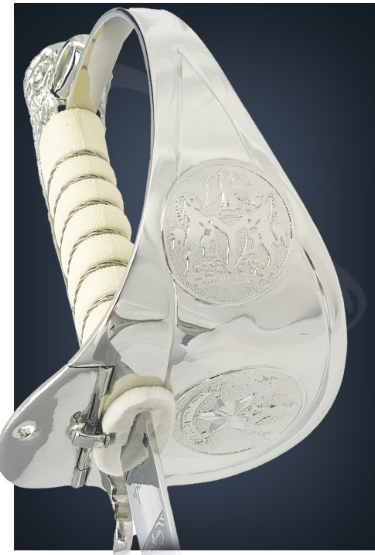
Sabre de Police Police sword