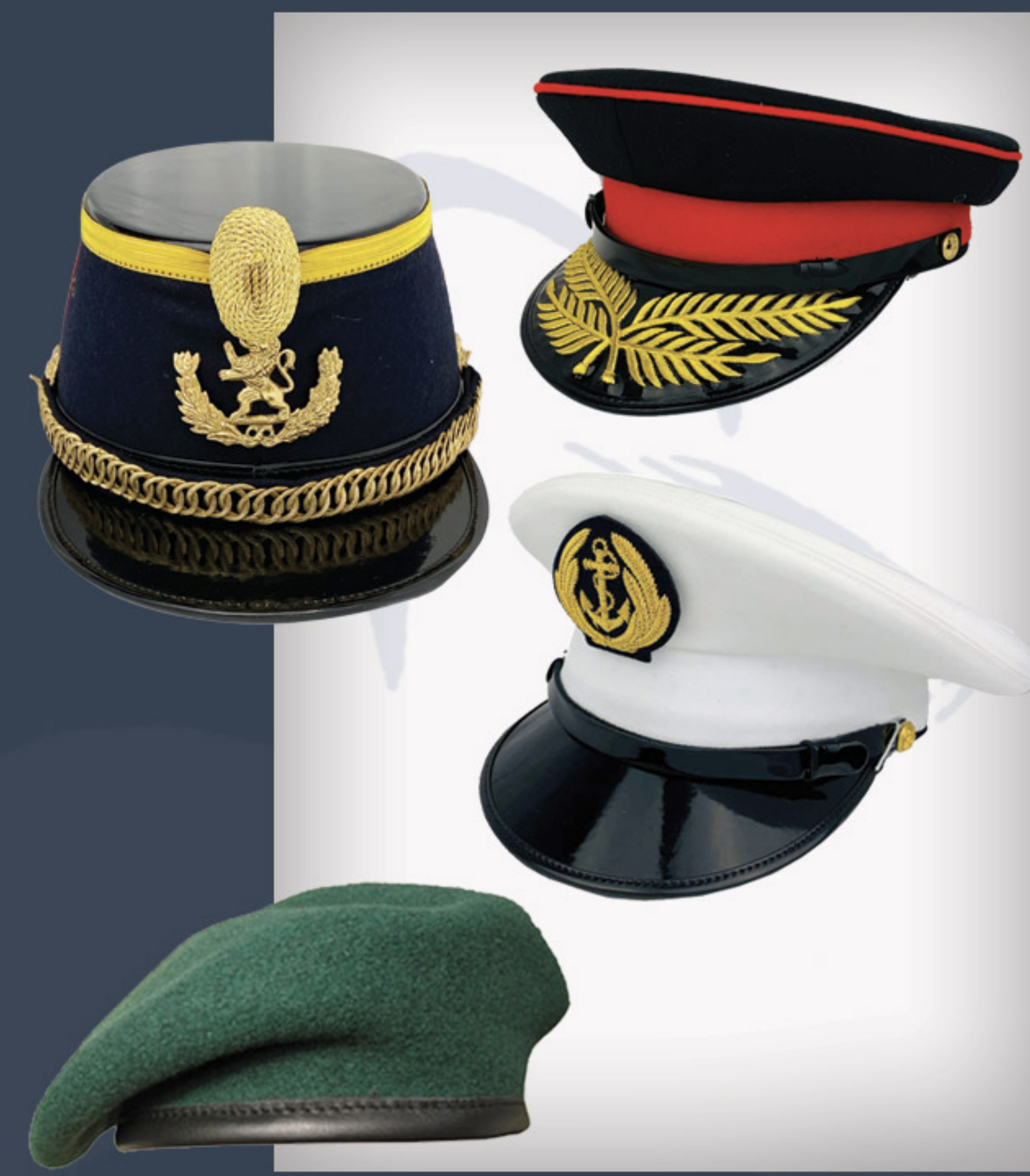
Coiffes, képis, bérets.. Headdress, peak caps, berets...