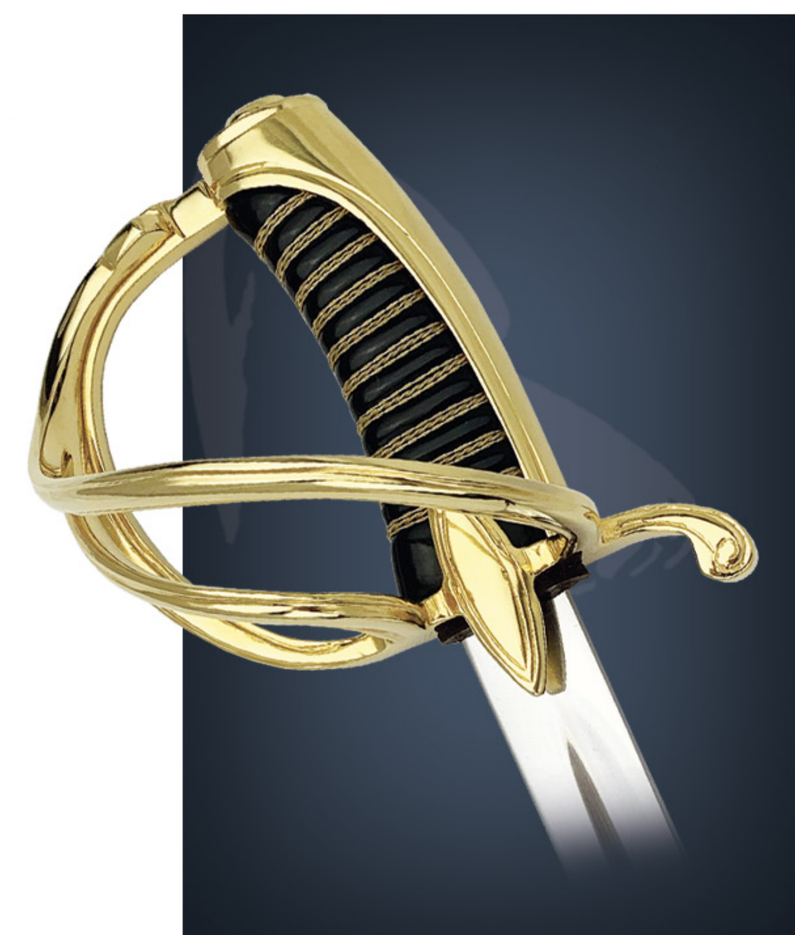
Sabre F1 F1 sword