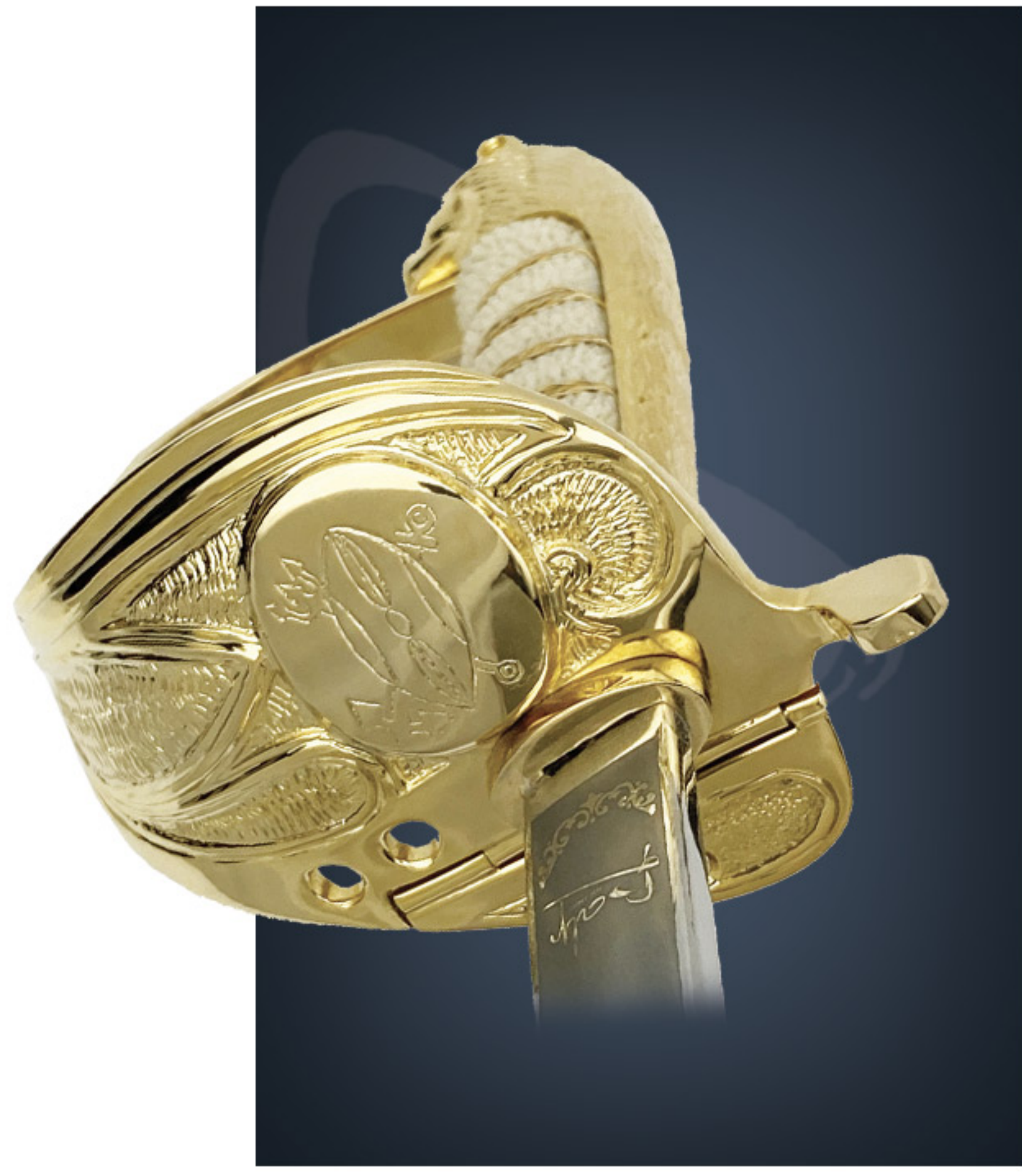
Sabre garde côte Coast guard sword