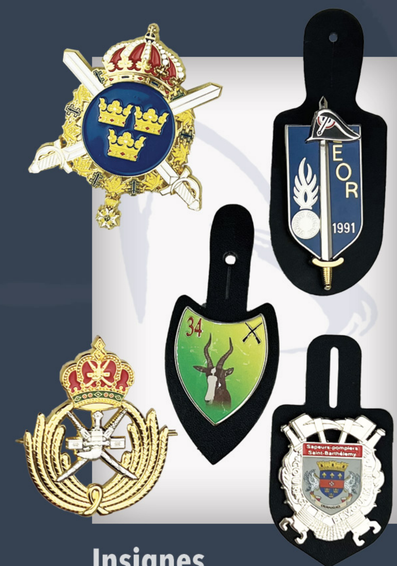
Insignes Metal badges