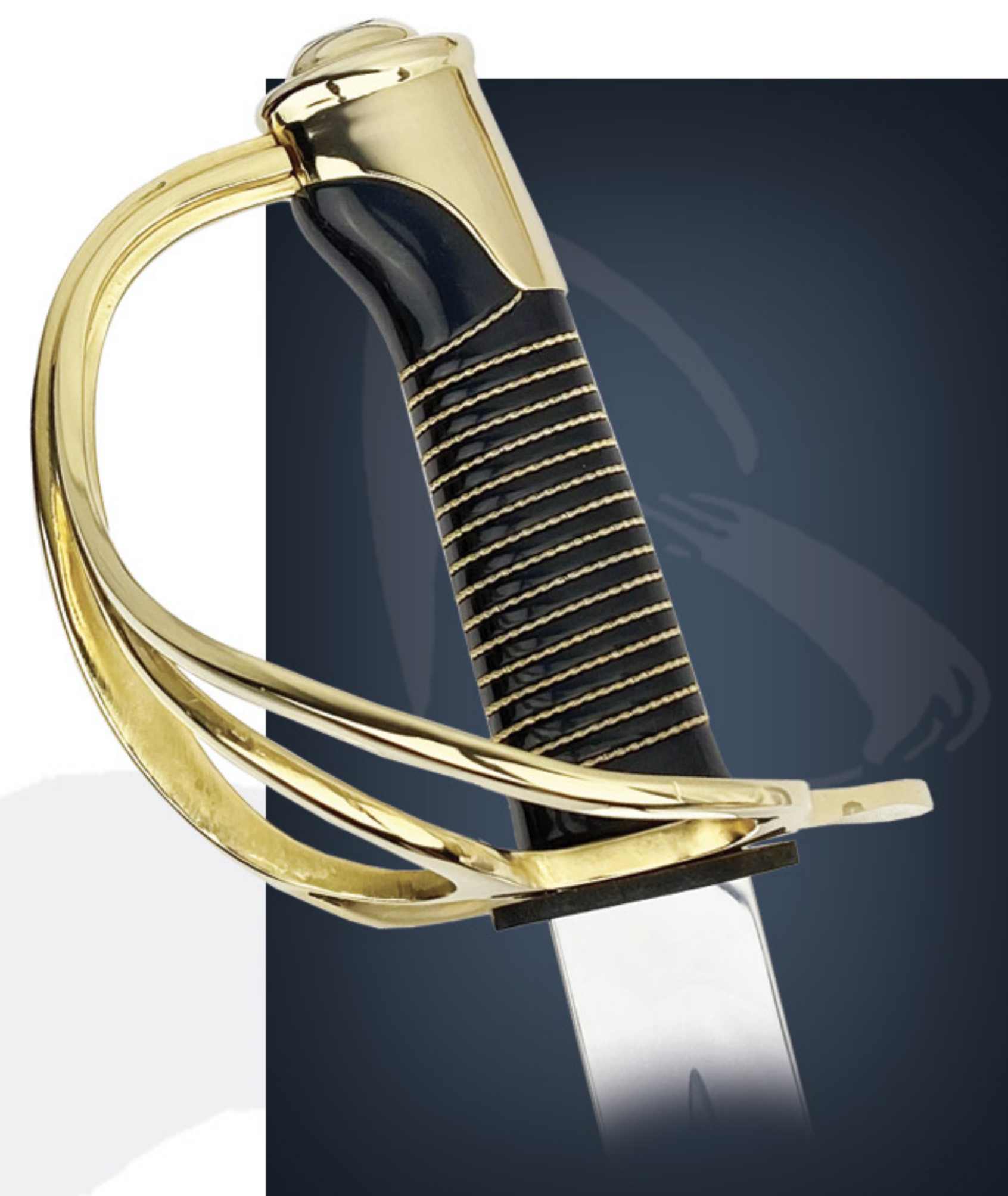
Sabre cavalerie m/1822 Cavalry sword m/1822