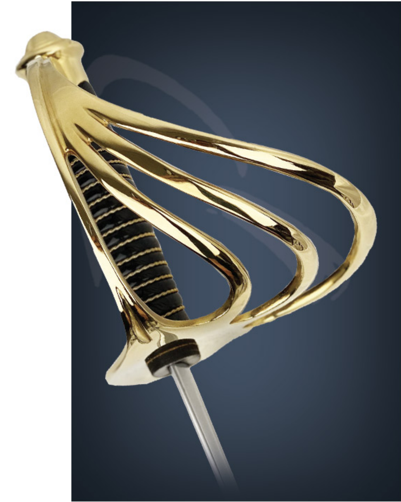
Sabre de l'EFA EFA sword