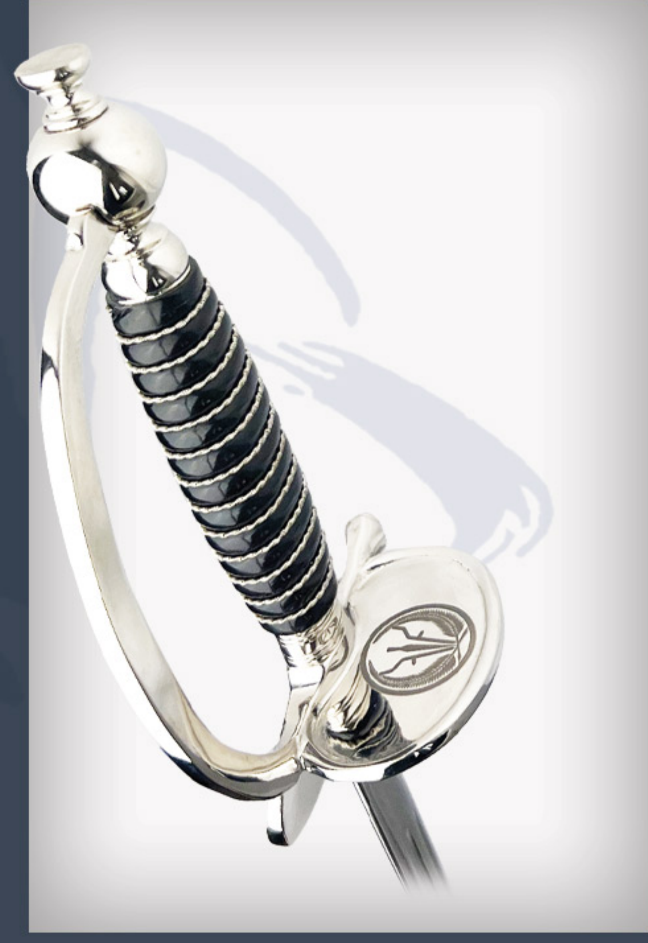
Epee GEMIA GEMIA sword