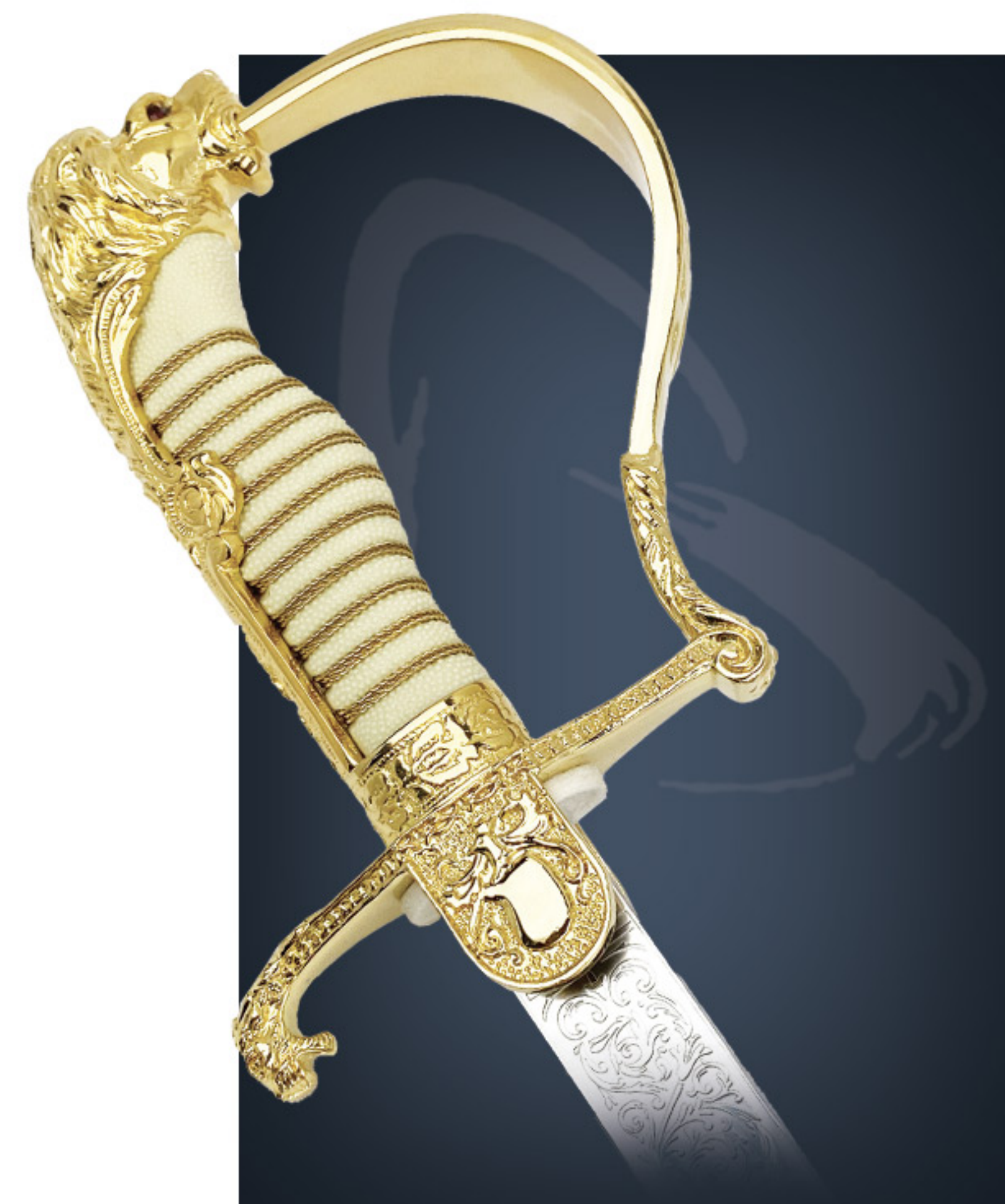
Sabre de général General sword