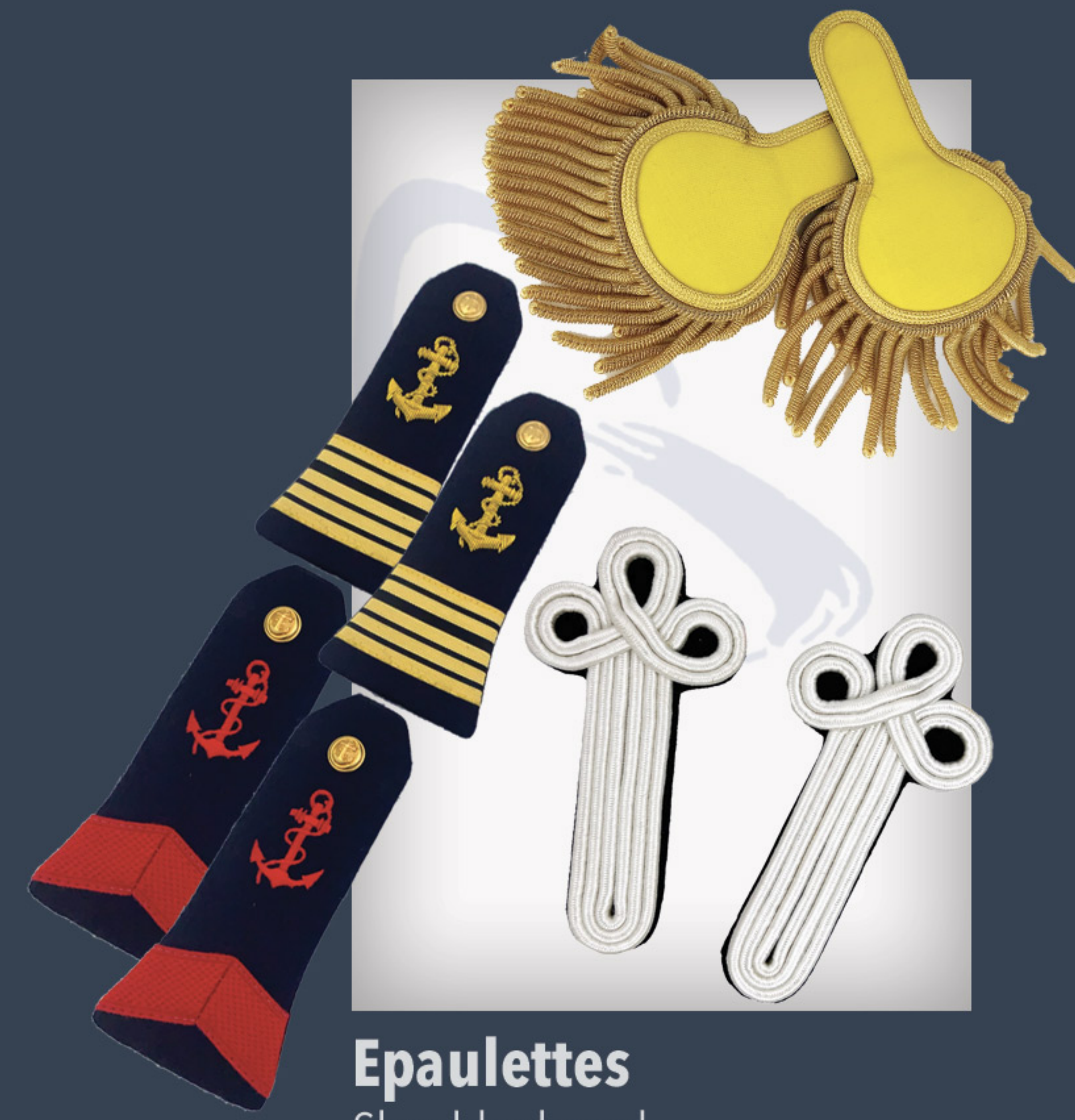
Epaulettes Shoulder board