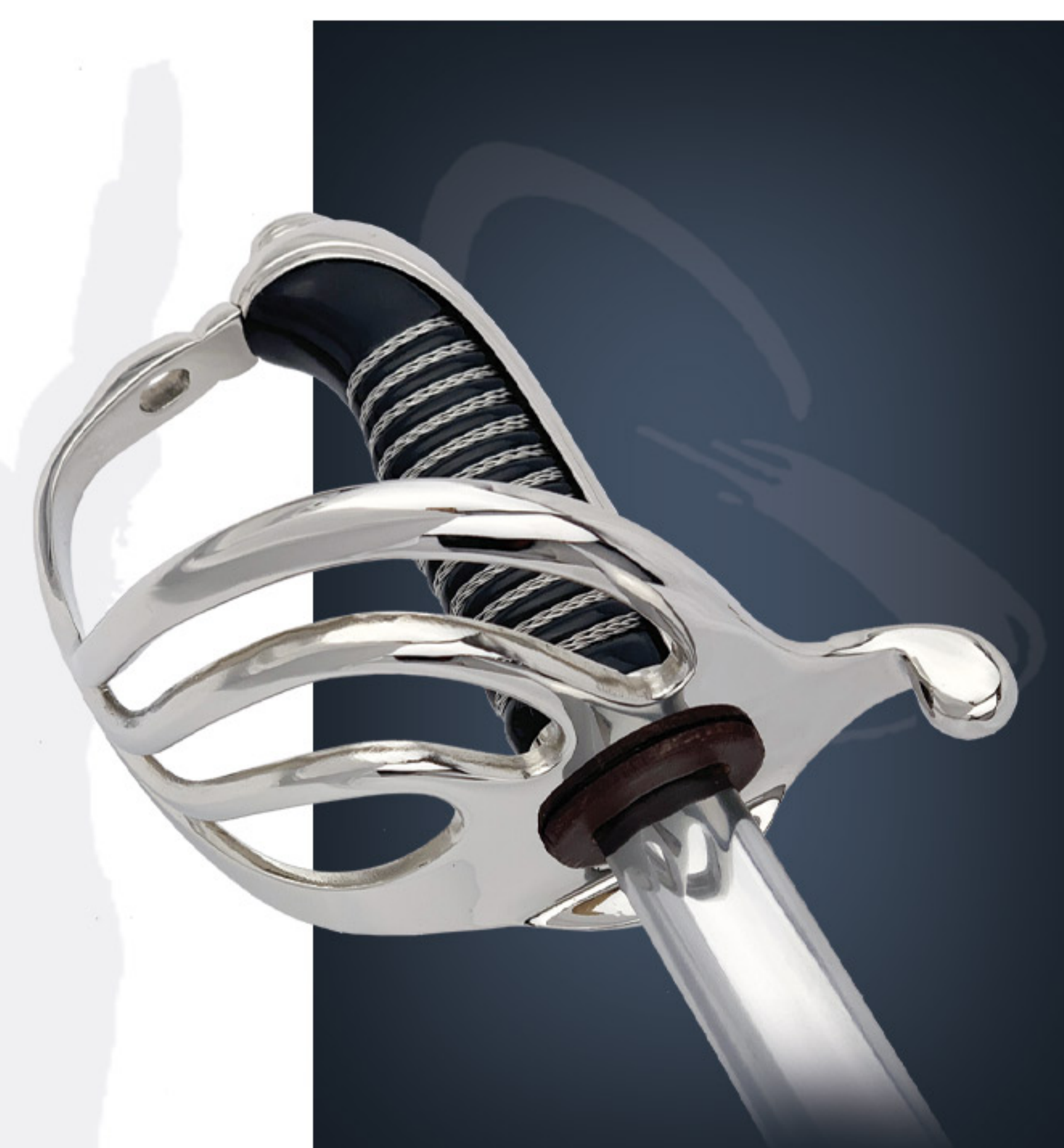
Sabre d'infanterie m/1882 Infantry sword m/1882