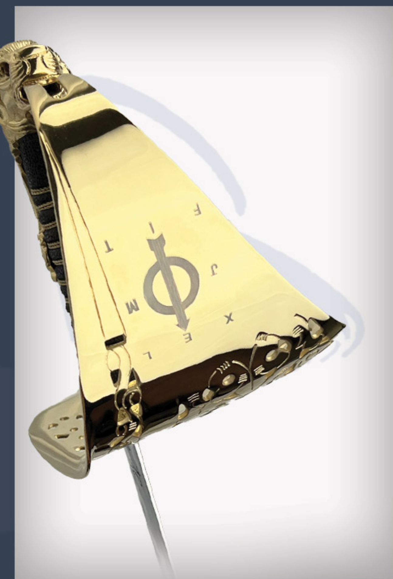
Saber de l'ENOA ENOA sword