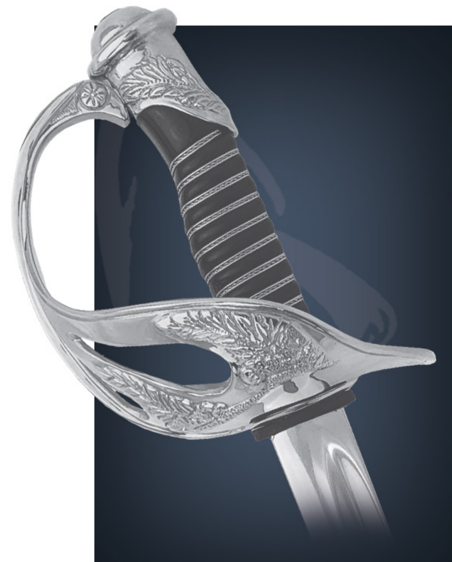
Sabre EFOMA EFOMA Sword