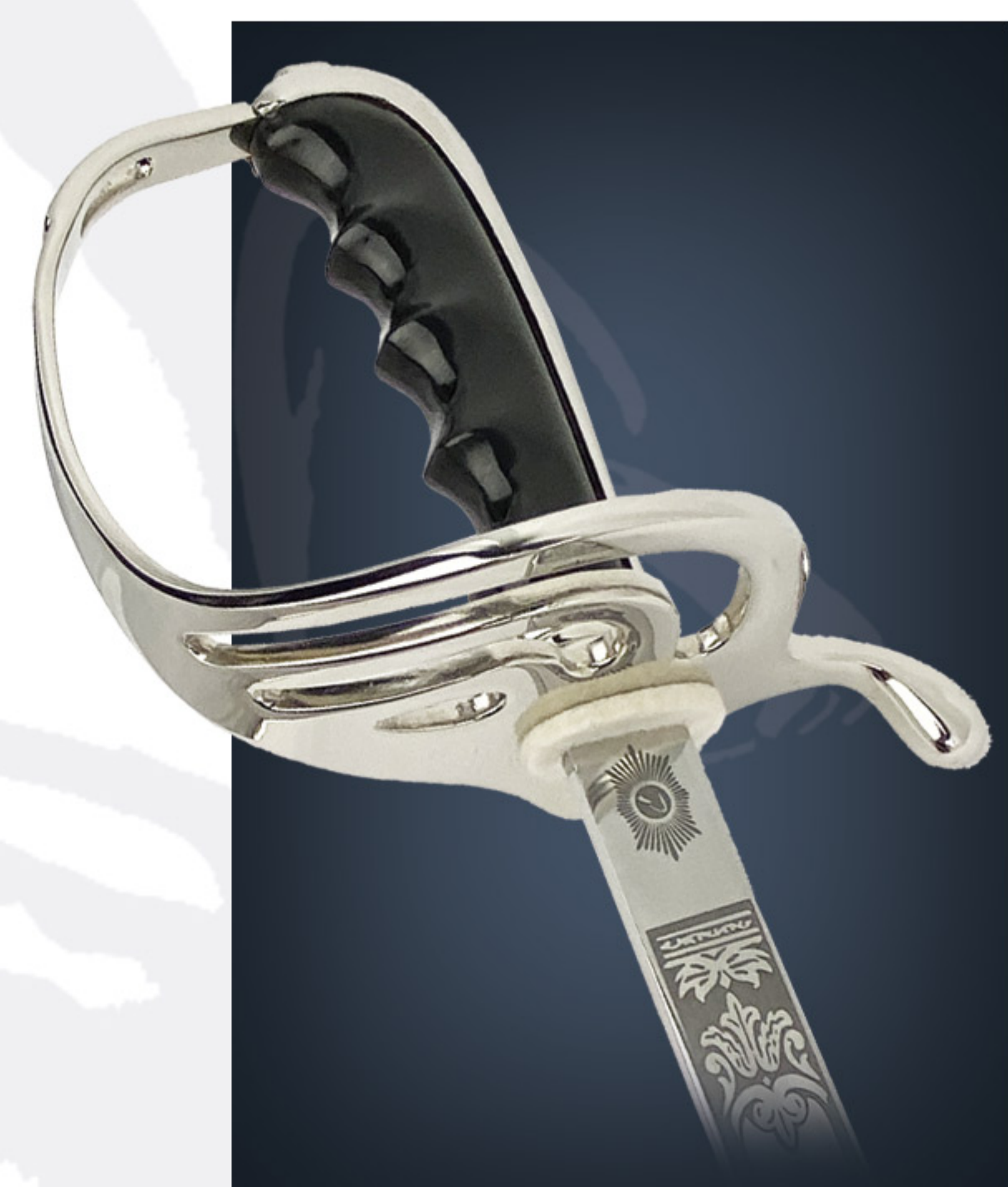
Sabre de armée terre Army sword