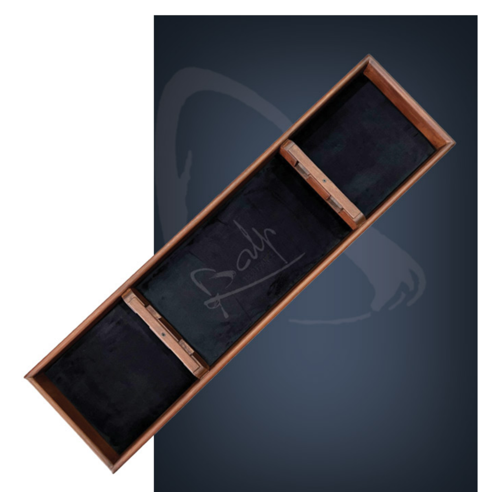
Holzschatulle für Säbel