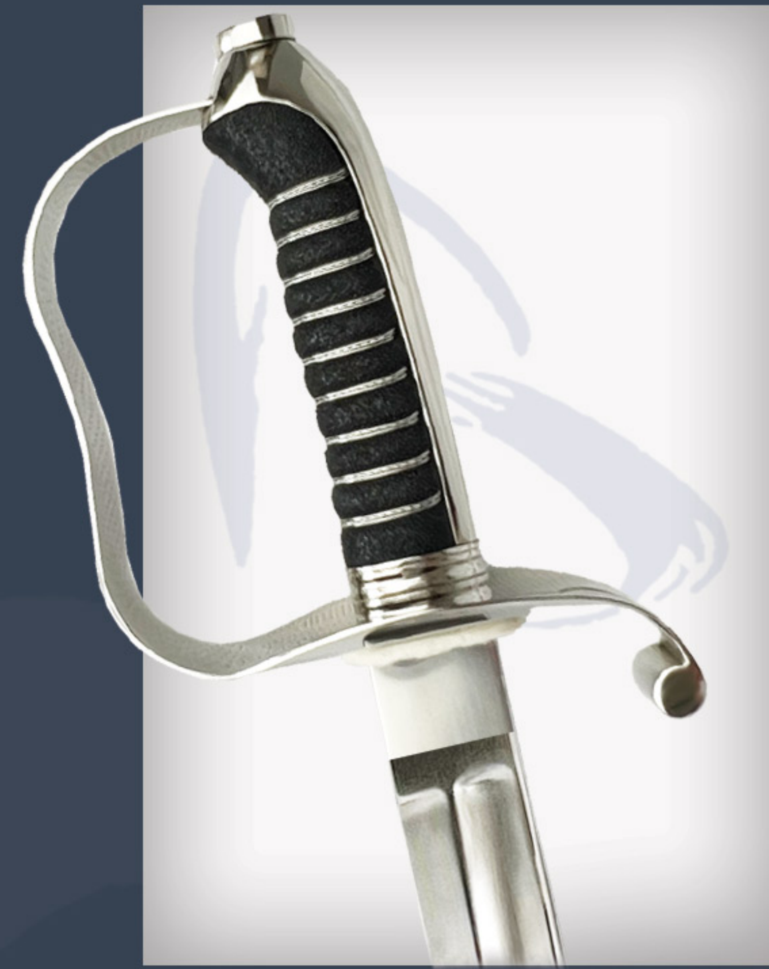
Infanterie Offizierssäbel, Modell 1861

Gegossen aus Messing, geschliffen und poliert. vernickelt. Rostfreier Stahl, handgeschmiedet, handgeschliffen und handpoliert. vernickelte Scheide mit einem Ring.