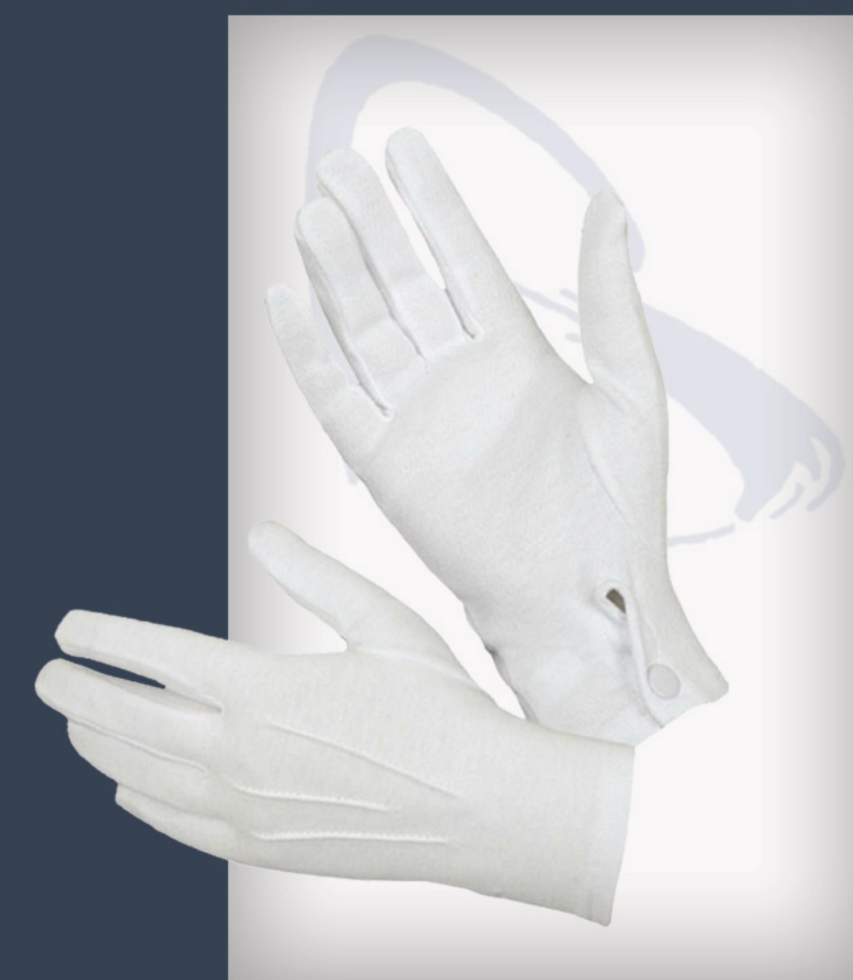
Handschuhe aus Baumwolle