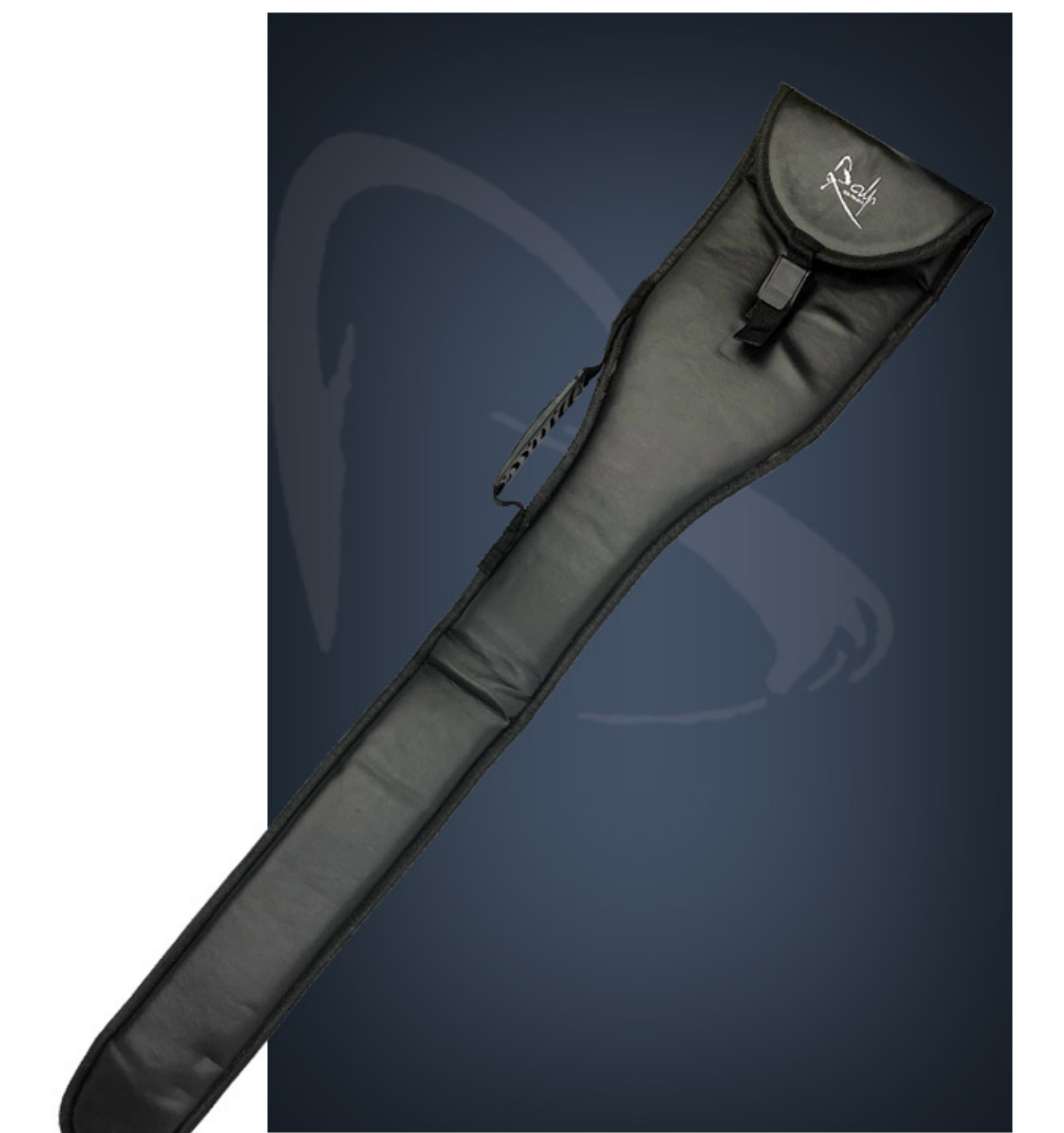
Vinyl-Tragetasche für Säbel