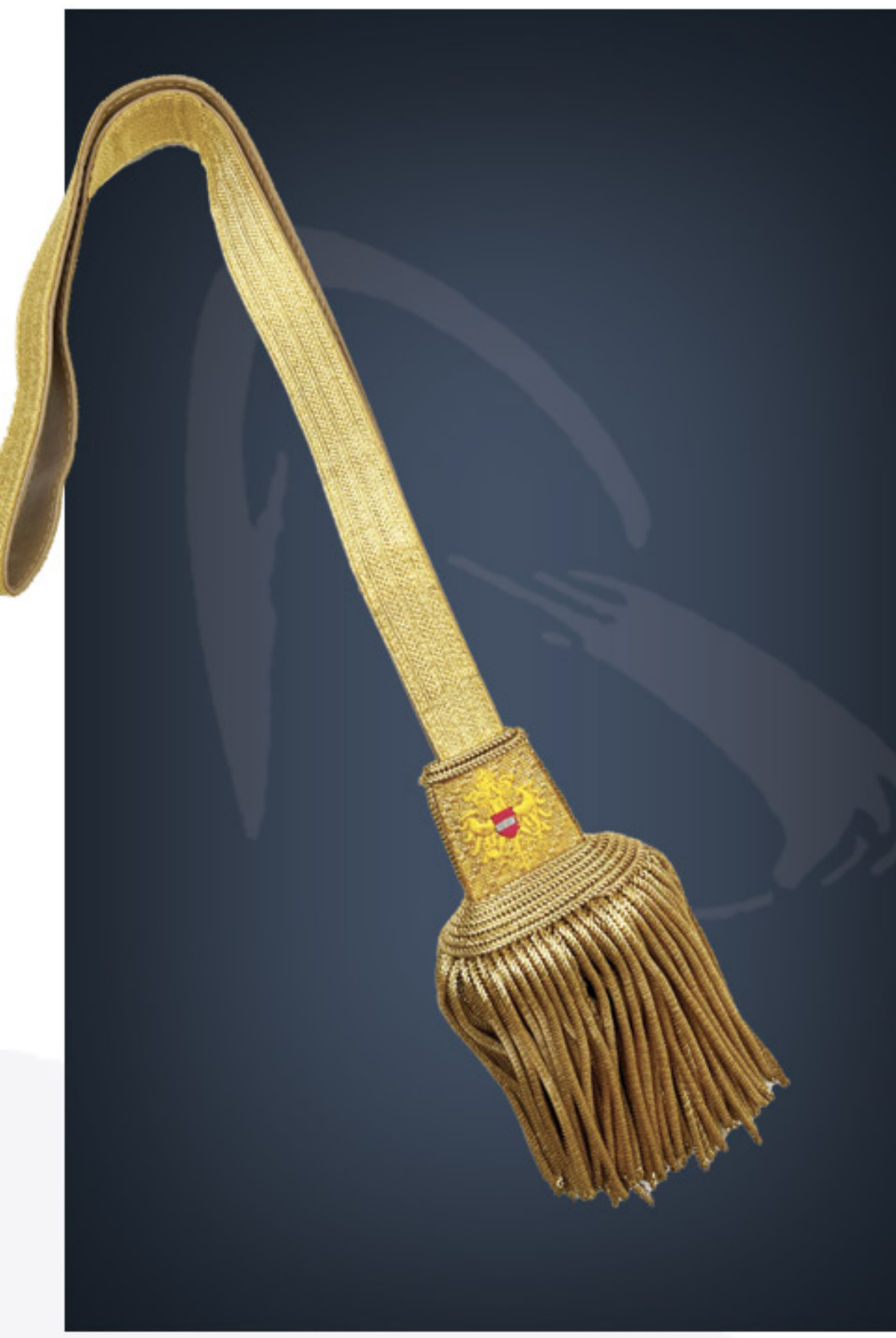
Portepe mit Bundesadler beitseitig - MILAK