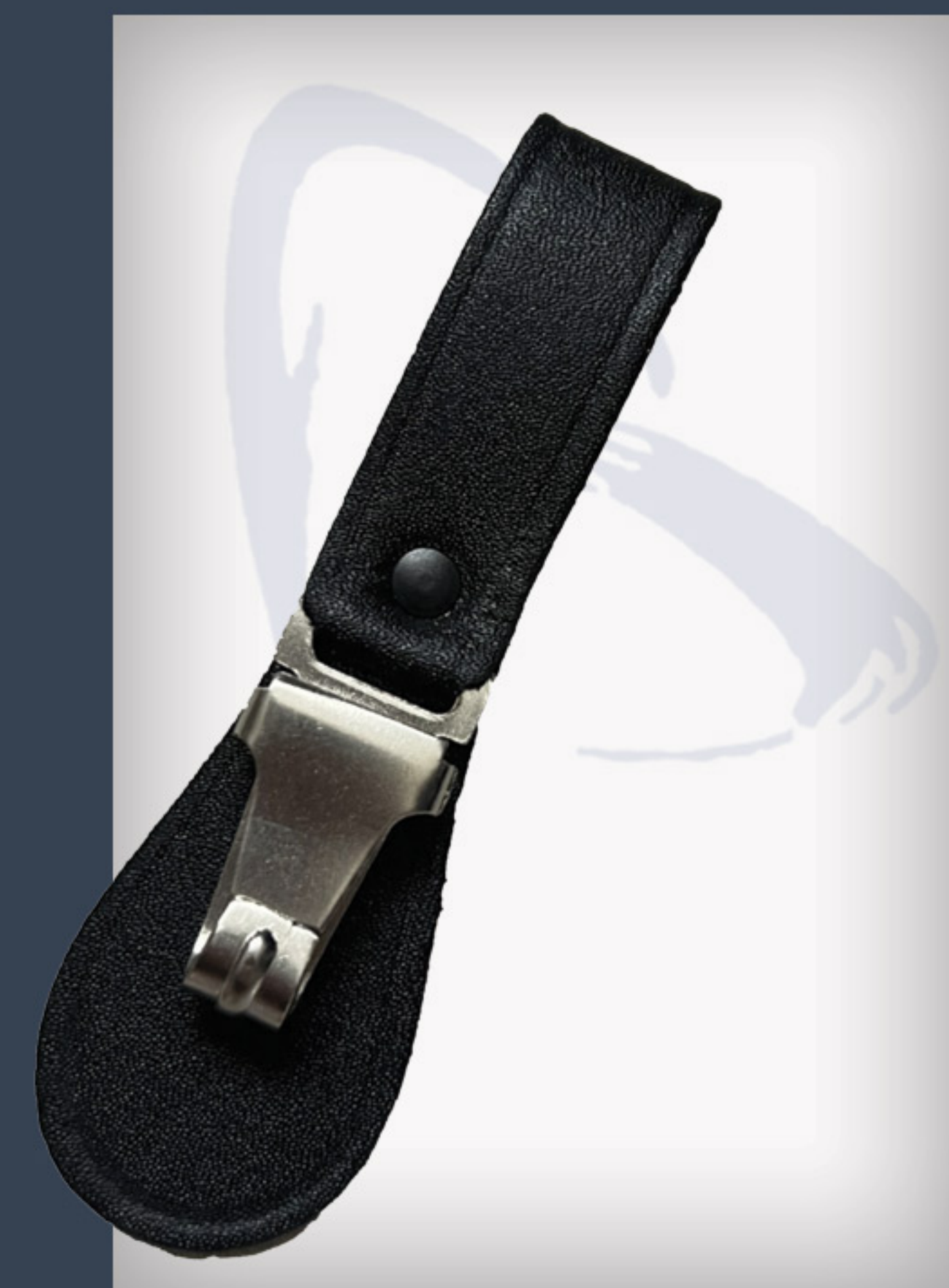
Lederschwerthalter mit Haken