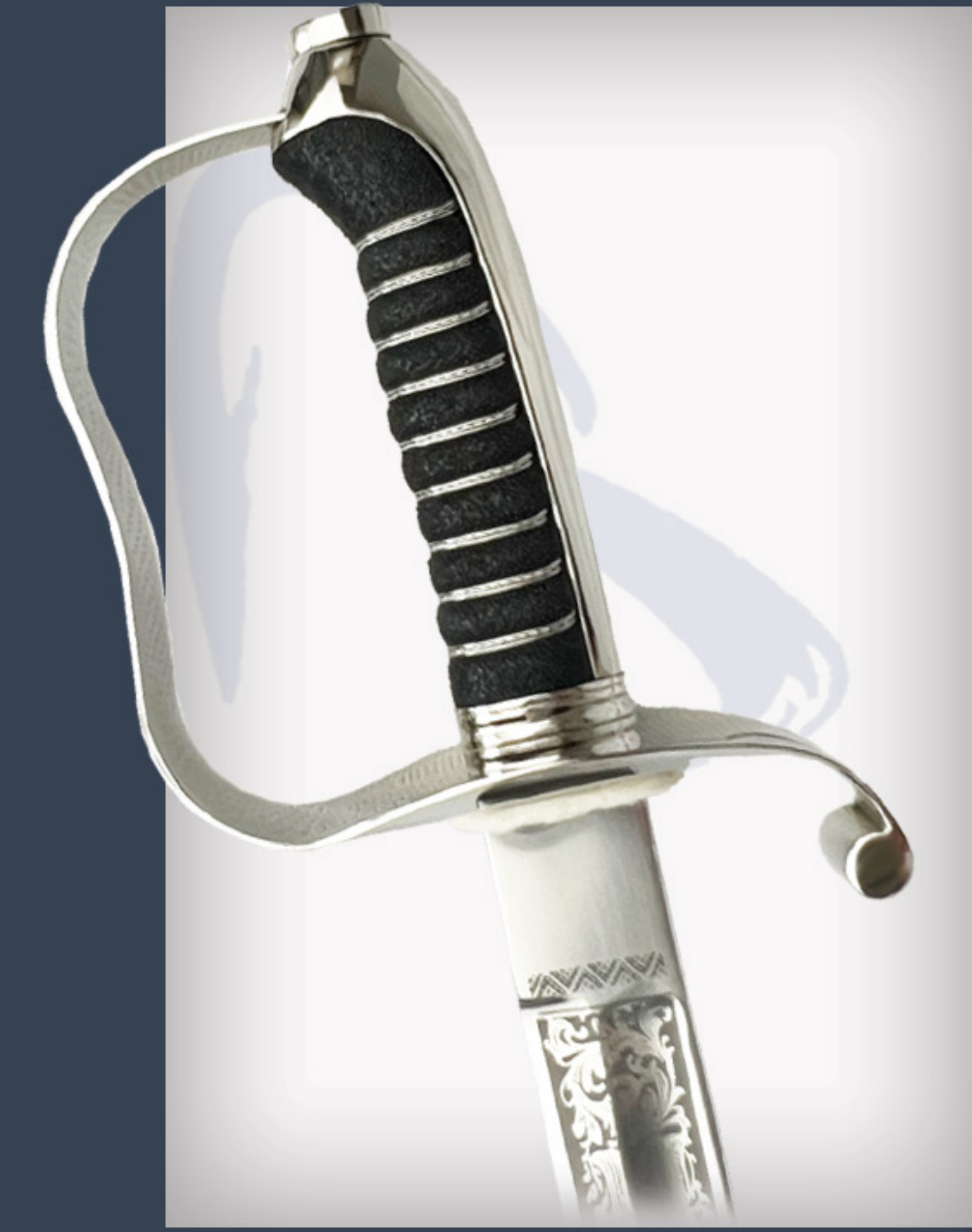
Infanterie Offizierssäbel, Modell 1861 mit Ätzung

Gegossen aus Messing, geschliffen und poliert. vernickelt. Rostfreier Stahl, handgeschmiedet, handgeschliffen und handpoliert, Säuregravur: "Treu bis zum Tod", vernickelte Scheide mit einem Ring.