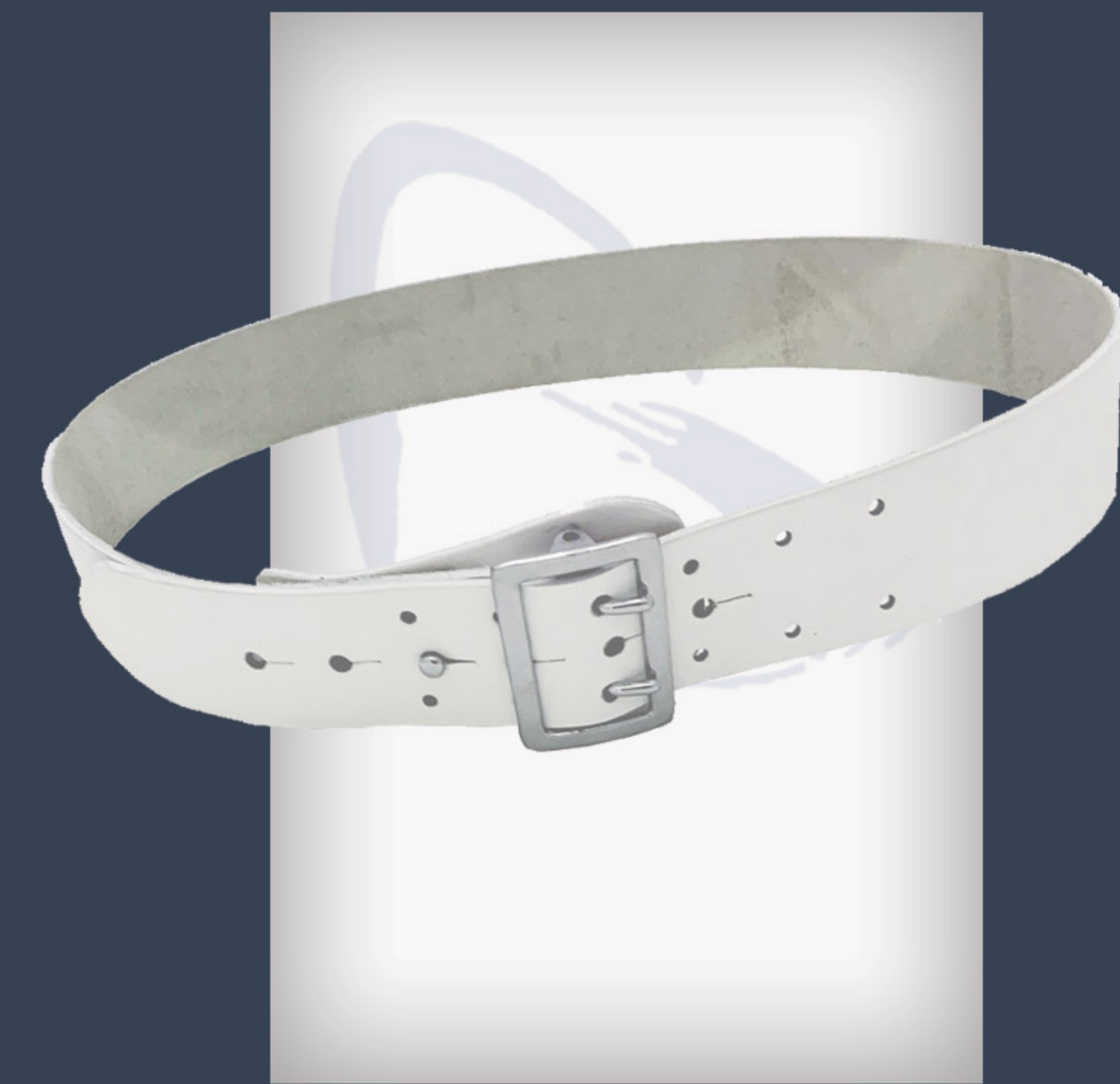
Gürtel - weißes Leder