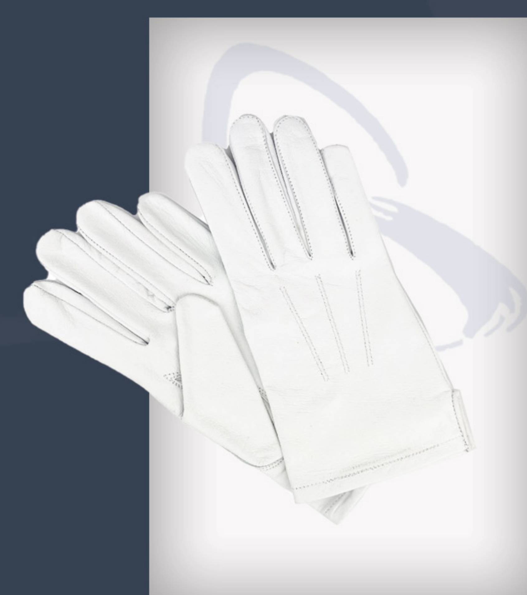
Weißer Lederhandschuh für Zeremonialsäbel