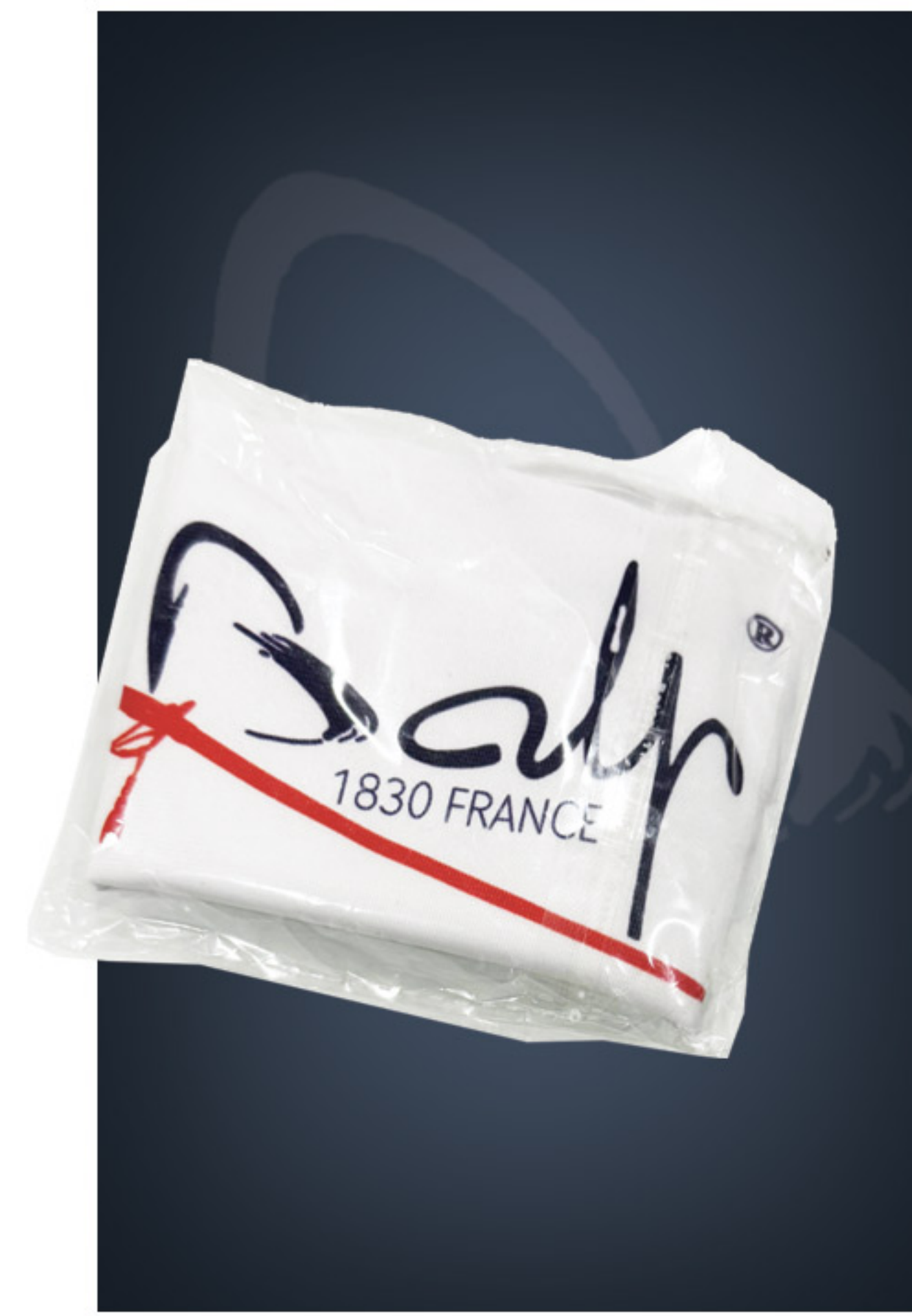
Reinigungstuch für vergoldete Teile