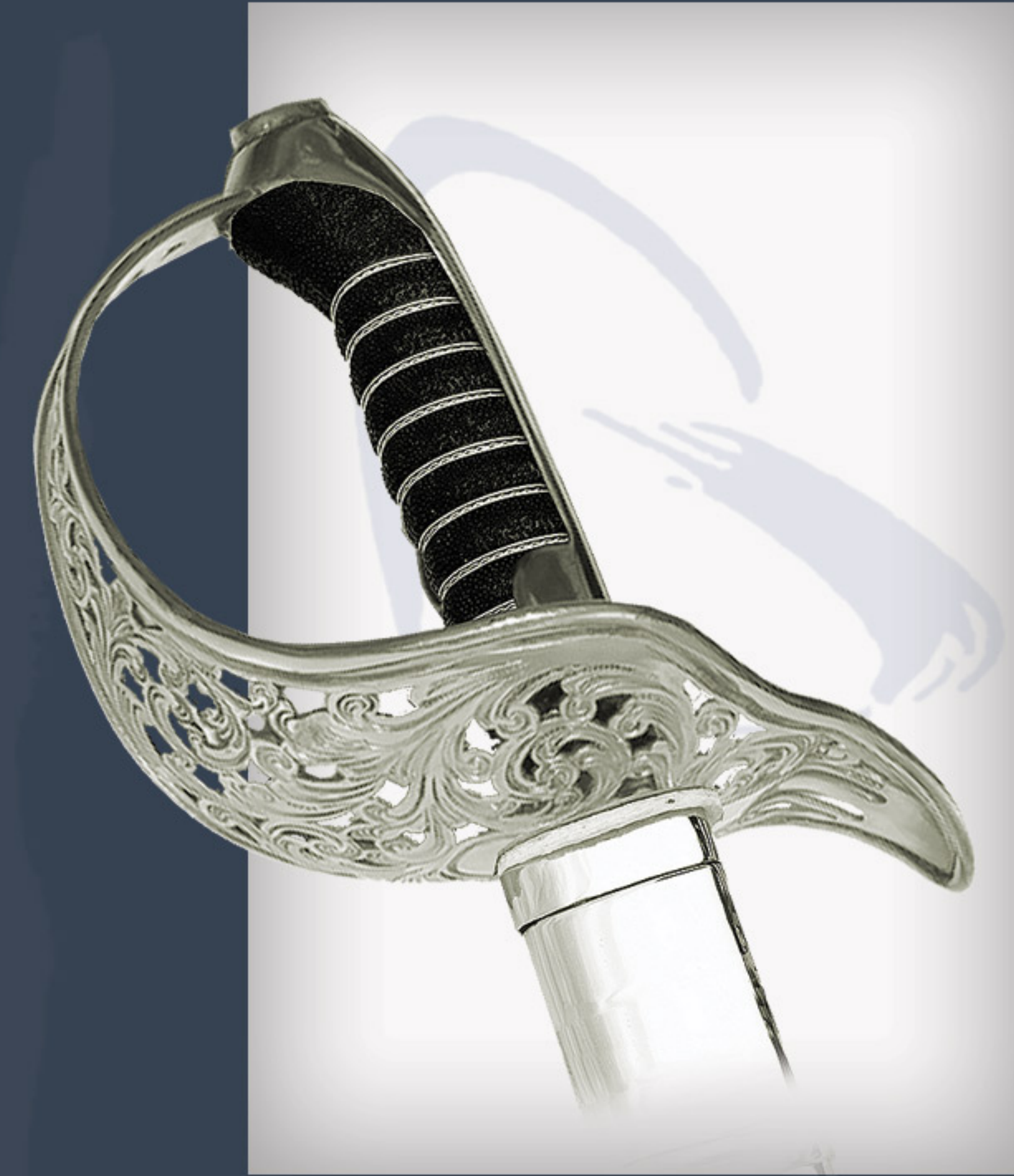
Kavallerie Offizierssäbel, Modell 1904

Gegossen aus Messing, geschliffen und poliert. vernickelt. Rostfreier Stahl, handgeschmiedet, handgeschliffen und handpoliert. vernickelte Scheide mit einem Ring.