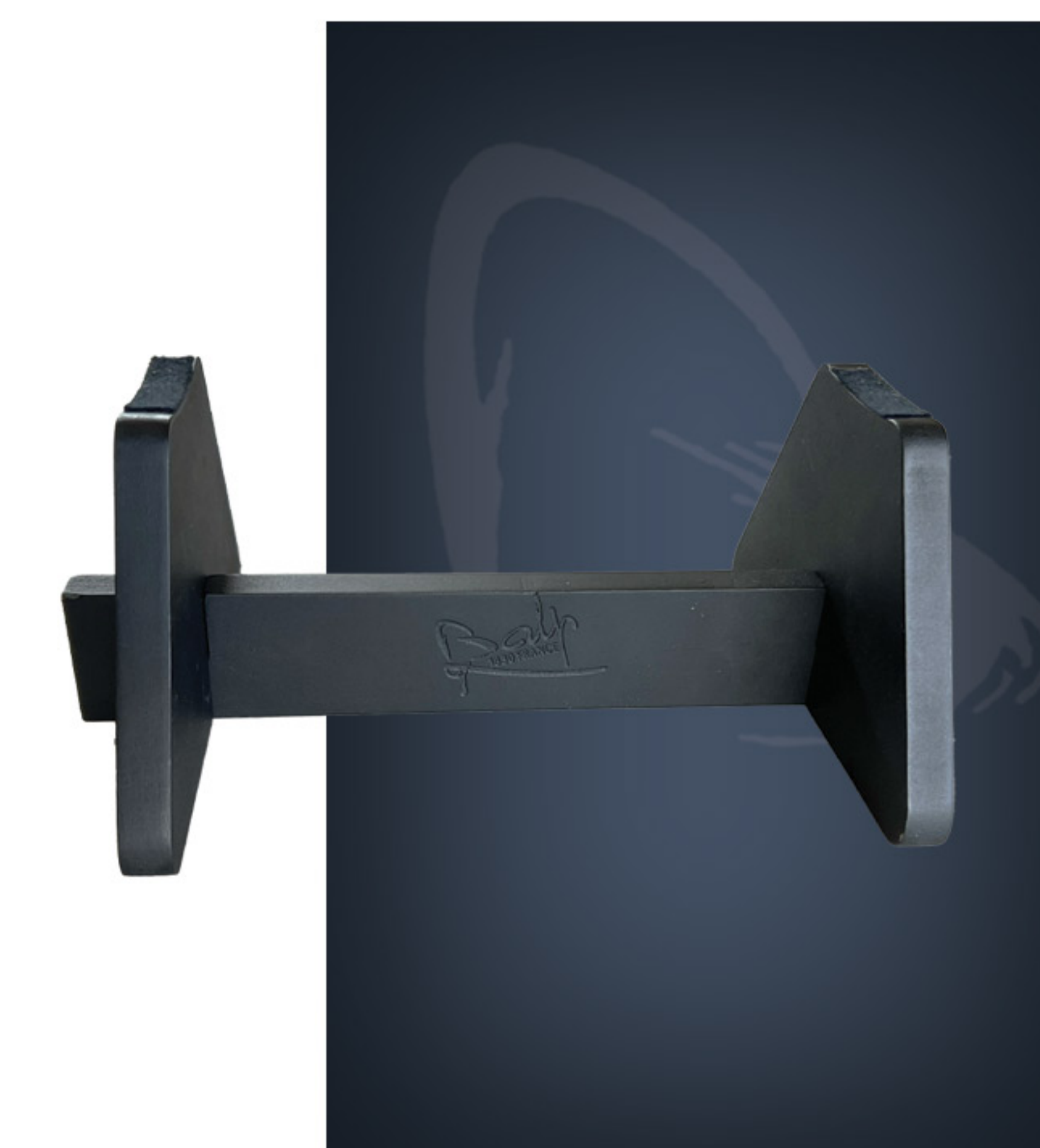
Holzständer für 1 Säbel