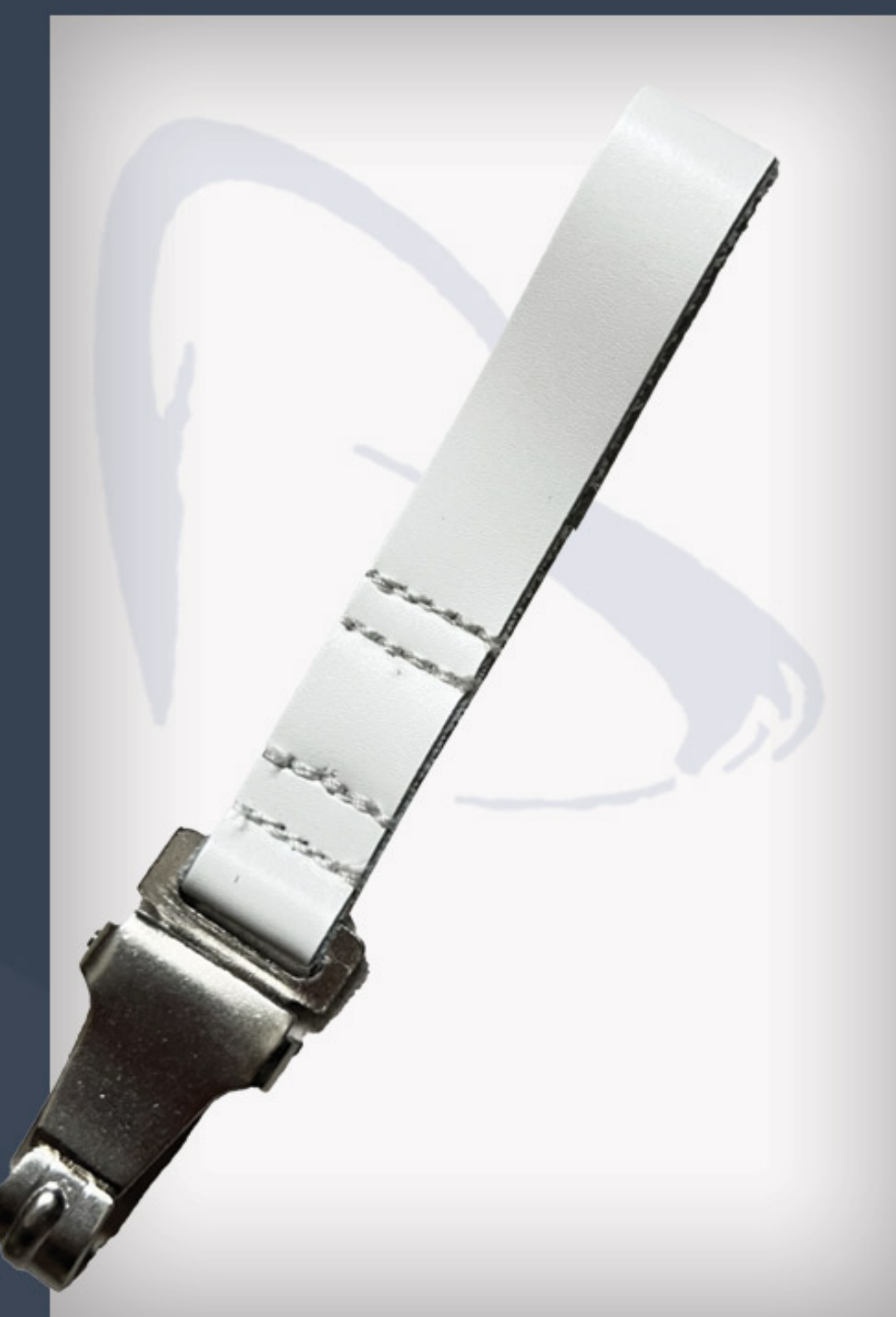
weißer Lederschwerthalter mit Haken