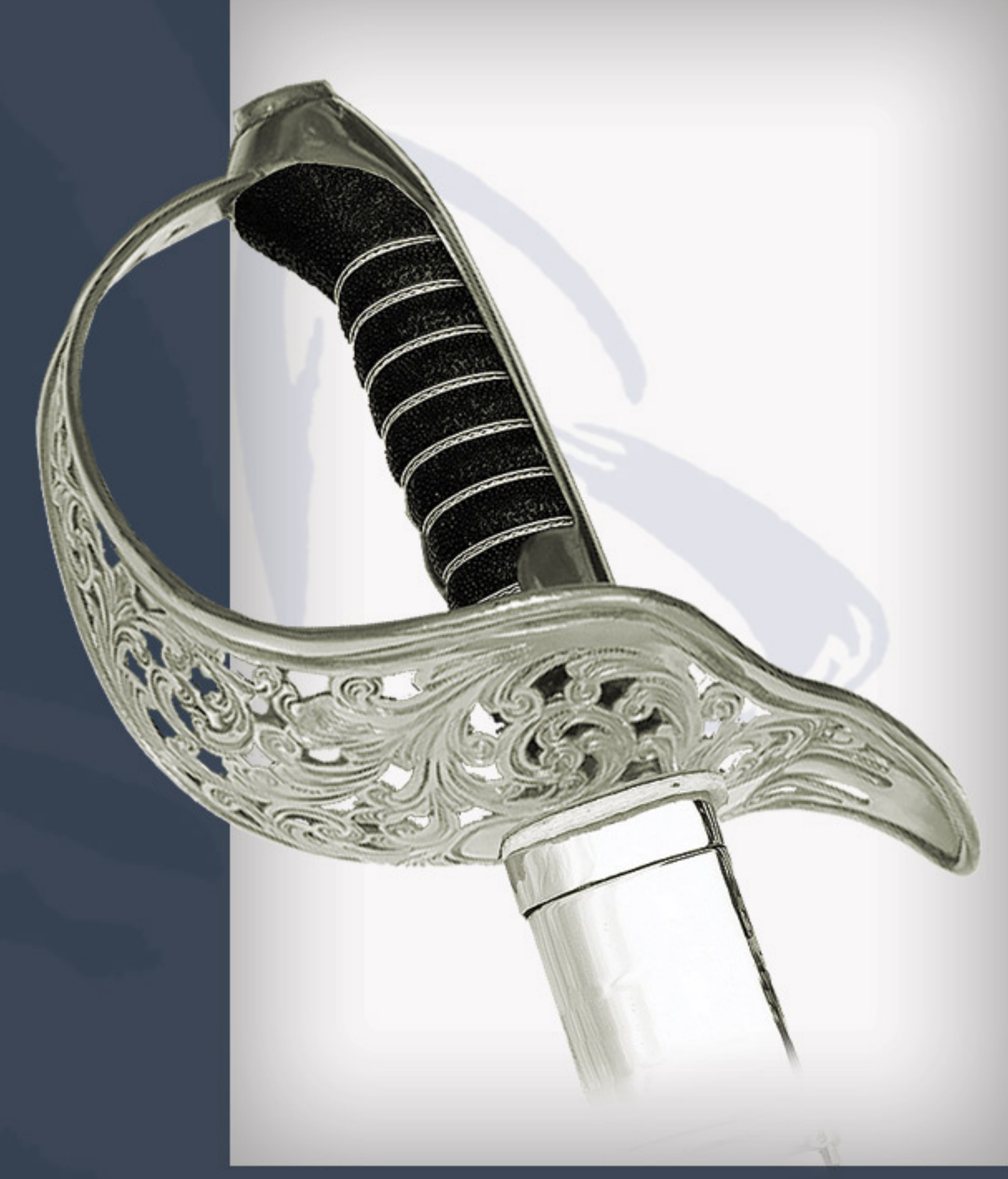
Kavallerie Offizierssäbel, Modell 1904 mit Ätzung

Gegossen aus Messing, geschliffen und poliert. vernickelt. Rostfreier Stahl, handgeschmiedet, handgeschliffen und handpoliert, Säuregravur: "Treu bis zum Tod", vernickelte Scheide mit einem Ring.