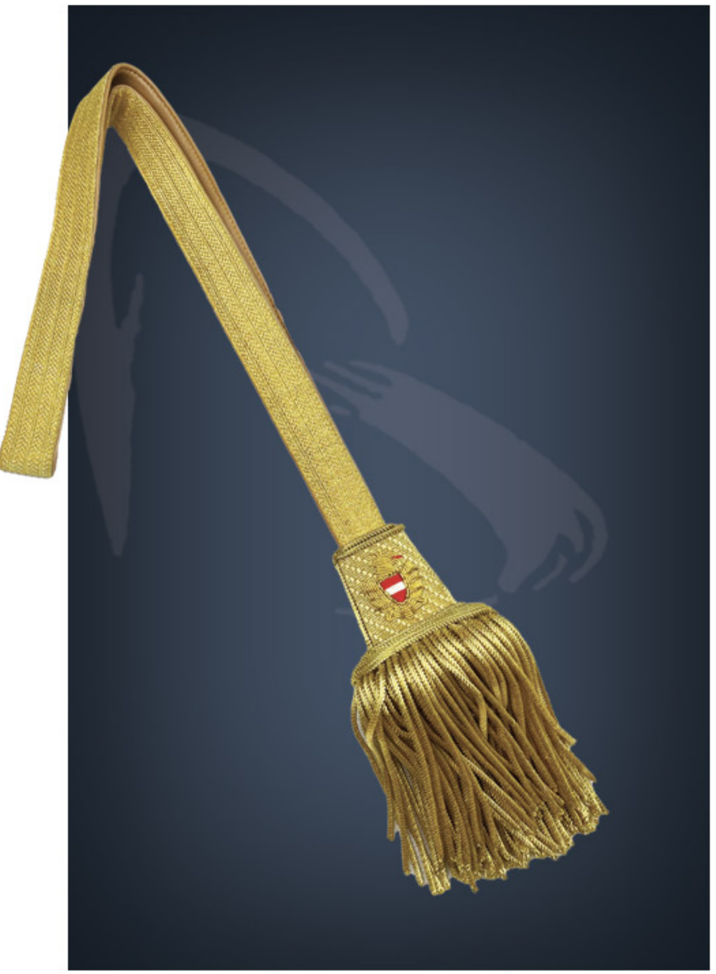
Portepe mit Bundesadler beitseitig