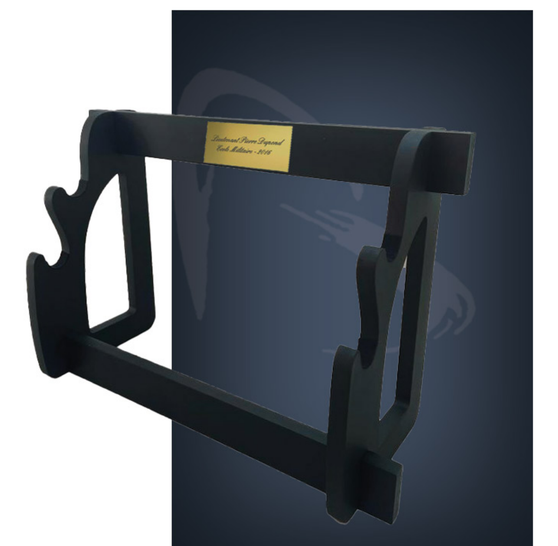
Massivholzständer für 1 Schwert und Scheide