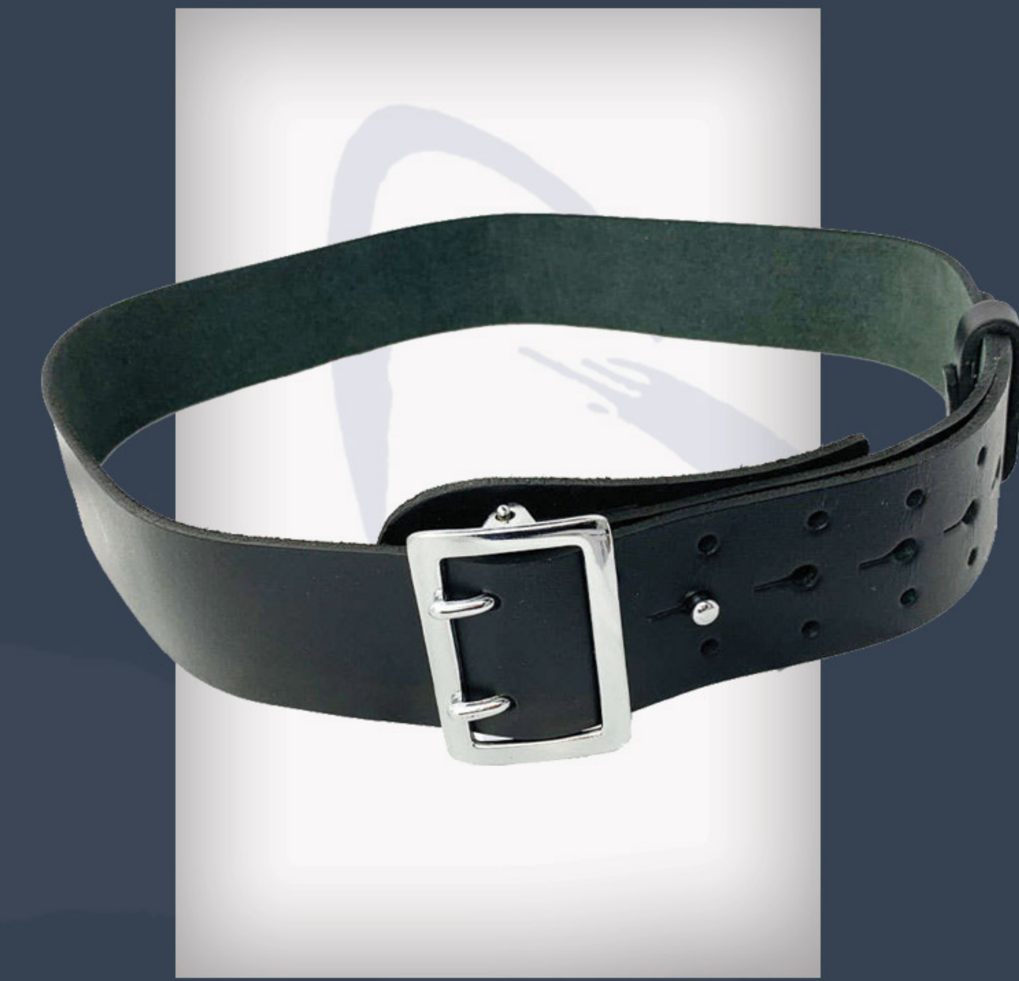
Gürtel - schwarzes Leder