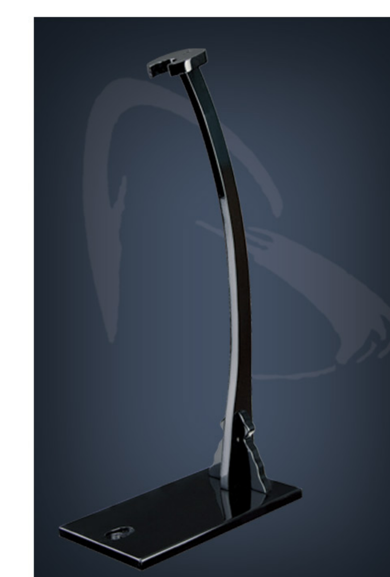
Vertikales Display für einen Säbel