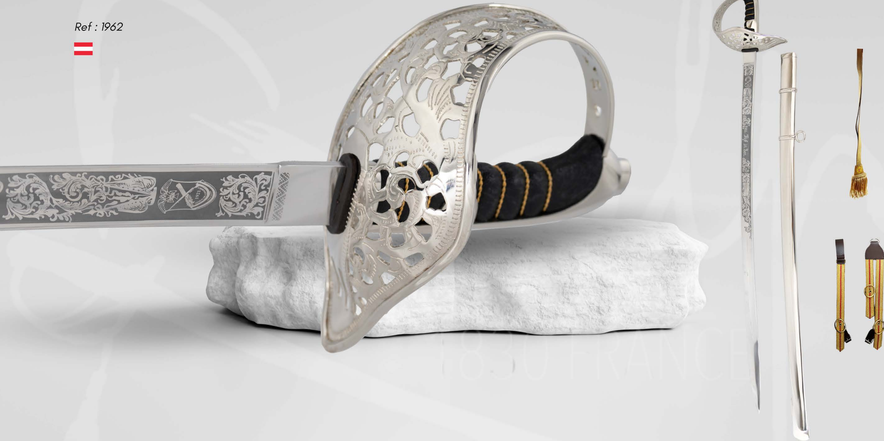
KAVALLERIE-OFFIZIERSÄBEL M 1904