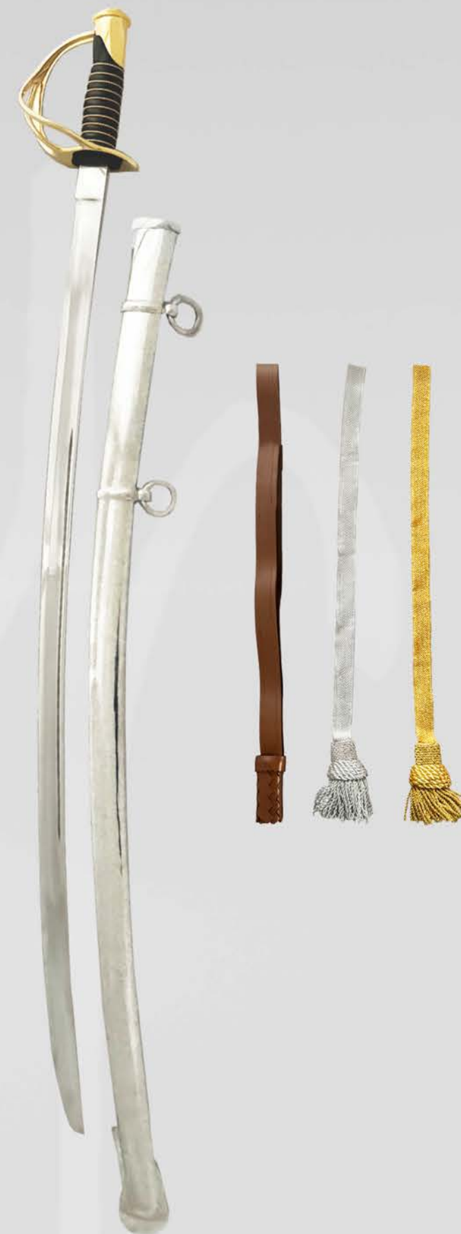
KAVALLERIESÄBEL - MILIZ WAADT MODELL 1854