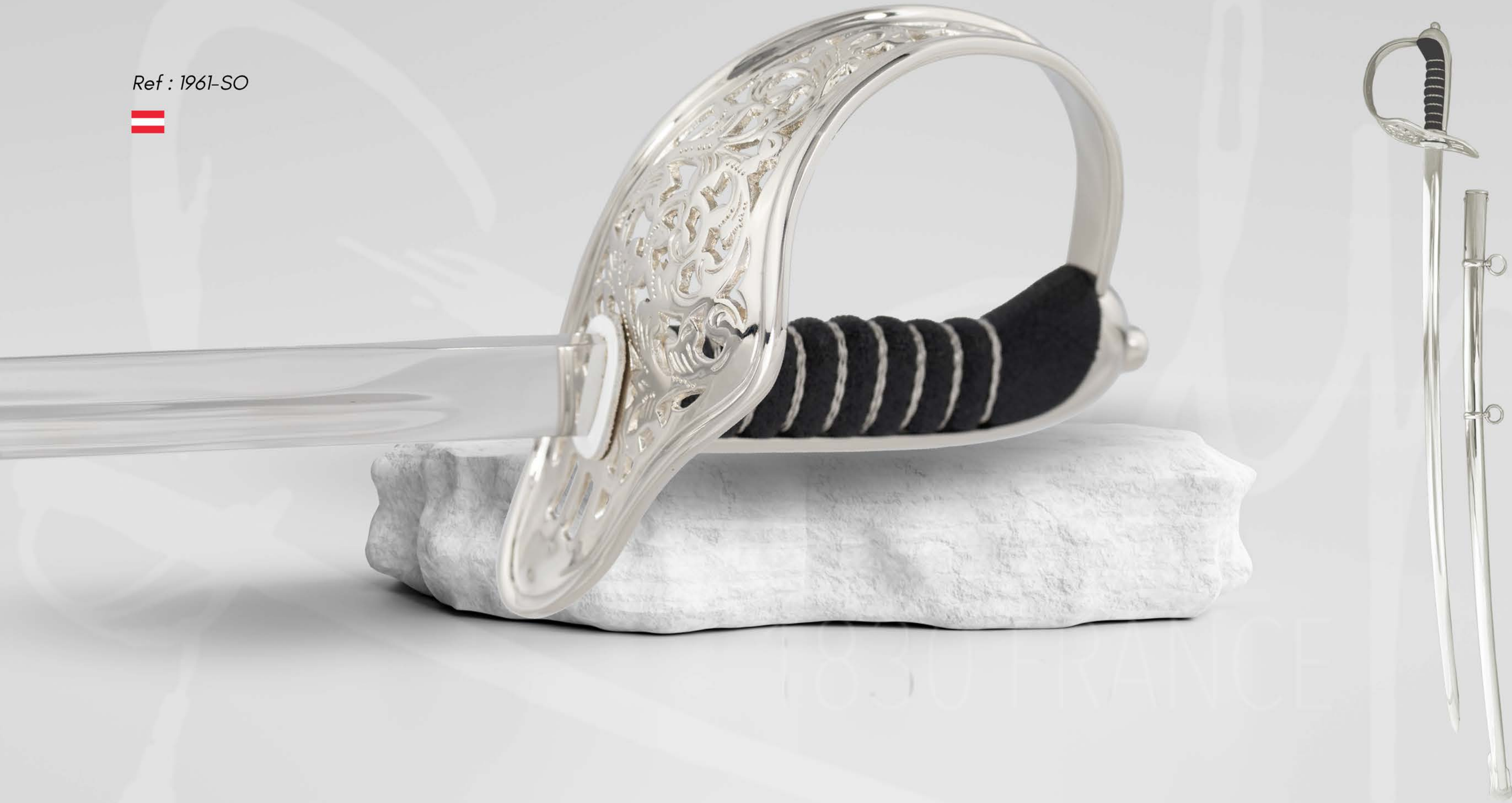
UNTEROFFIZIERSSÄBEL MODEL 1861