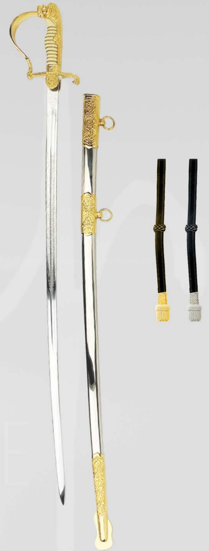
GENERALSÄBEL / KÖNIGSSÄBEL