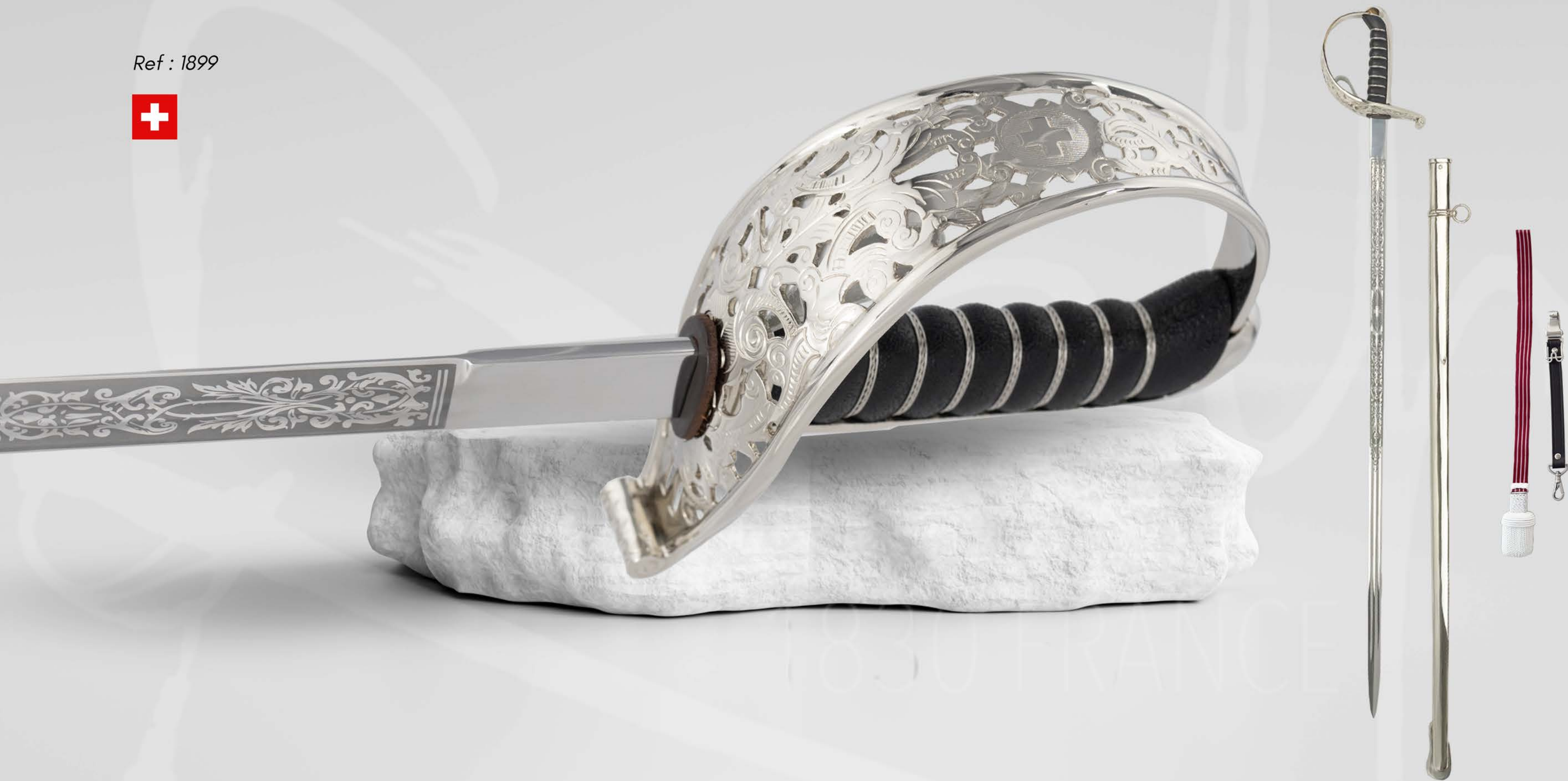
OFFIZIERSÄBEL MODELL 1899