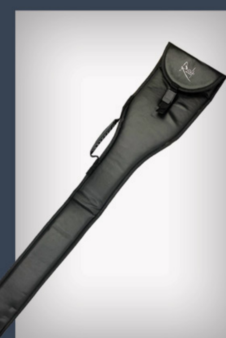
Housse de transport