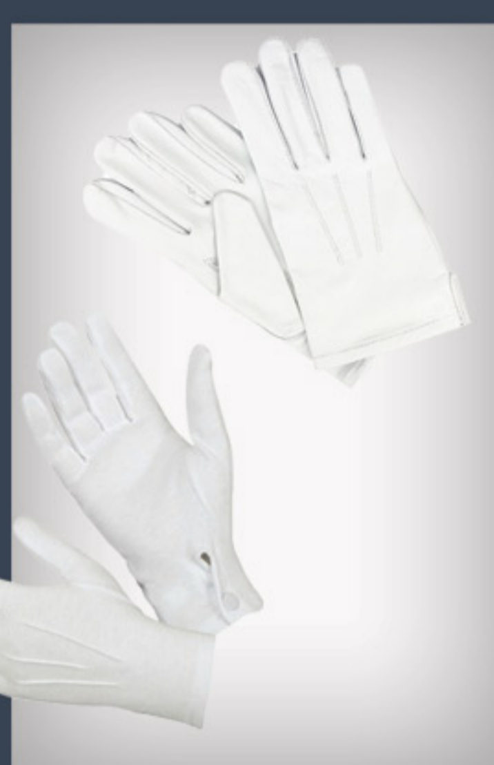
Gants de cérémonie