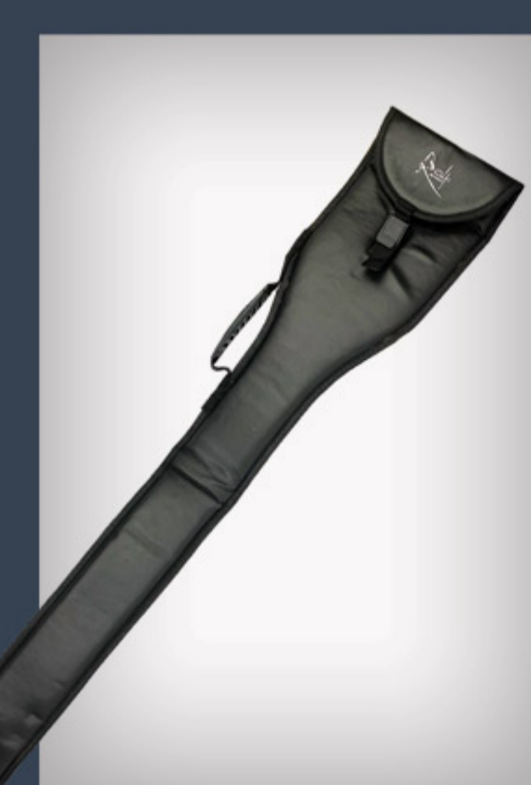
Housse de transport