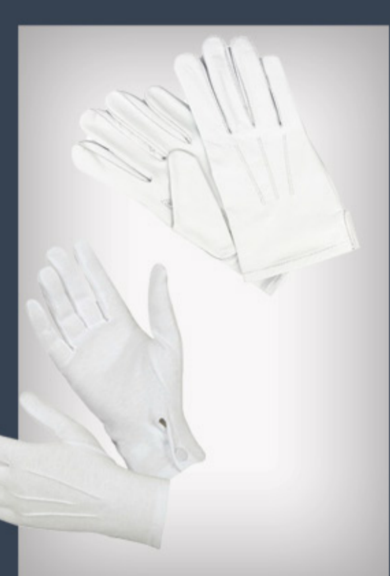
Gants de cérémonie