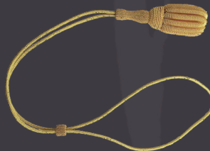
Dragonne bouillon or cordon or