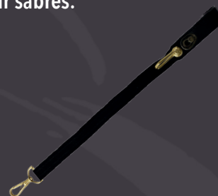
Bélière avec bouton emblème armement